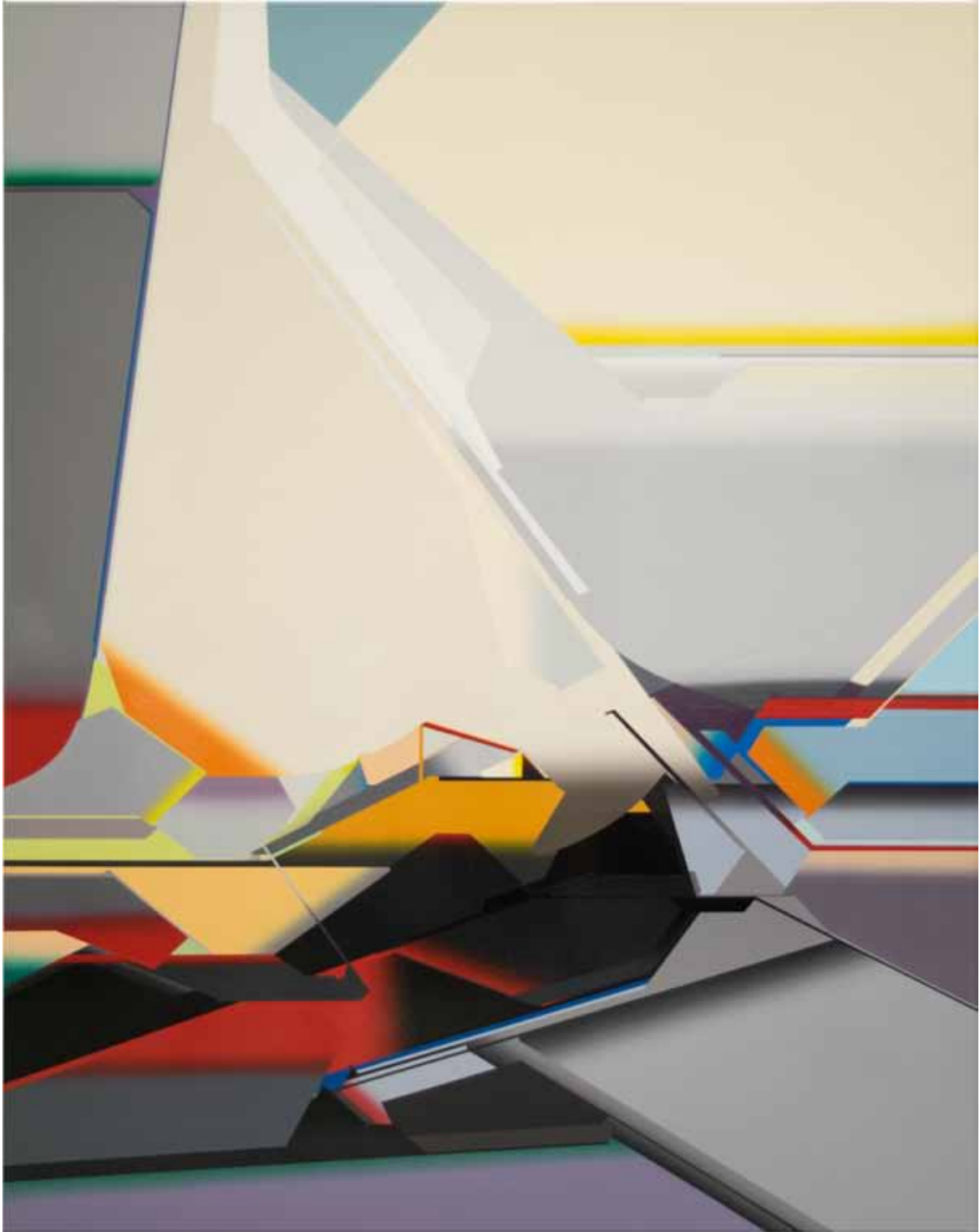
Marc von der Hocht Vectra 2017, 74,8 x 59,05 in. (190 x 150 cm), gloss enamel on cotton

SEMJON CONTEMPORARY GALERIE FÜR ZEITGENÖSSISCHE KUNST