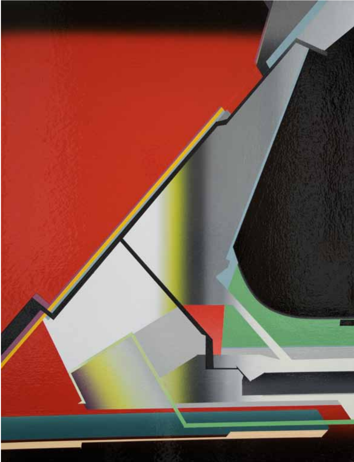
Marc von der Hocht Cascada 2017, 20,47 x 15,75 in. (52 x 40 cm), gloss enamel on cotton Photo: Marc von der Hocht

SEMJON CONTEMPORARY GALERIE FÜR ZEITGENÖSSISCHE KUNST