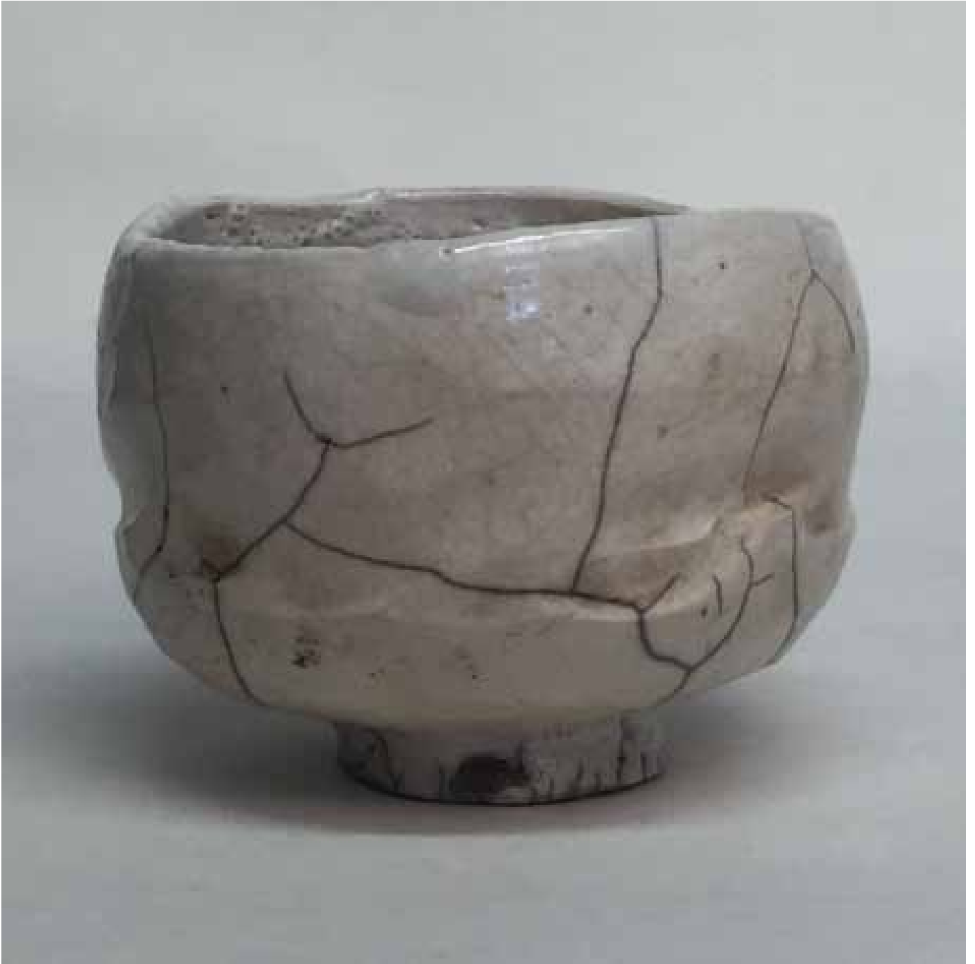
Cornelia Nagel Winterteeschale / Winter Tea Bowl 2004, ca. 7,7 x 10,5 x 10,4 cm Raku fired ware, 1000° C, oxide, transparent glazing