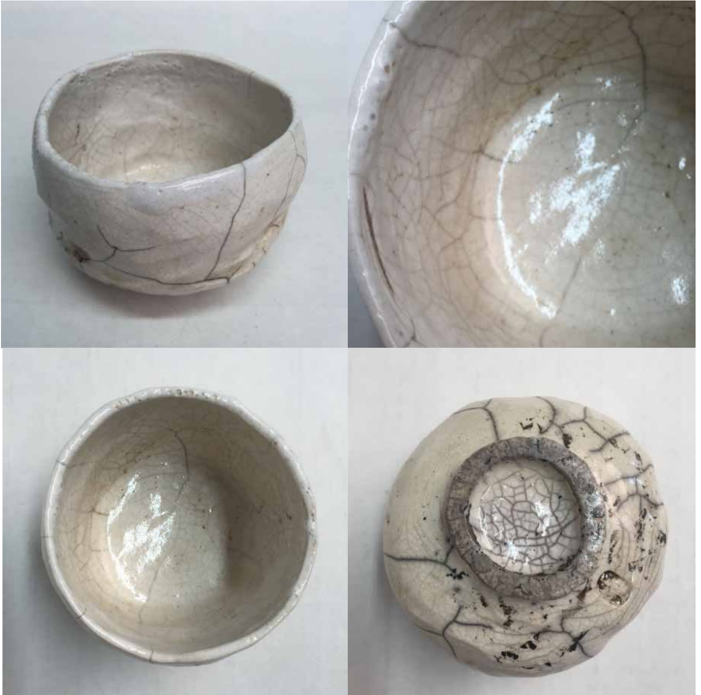
Cornelia Nagel Winterteeschale / Winter Tea Bowl , various views 2004, ca. 7,7 x 10,5 x 10,4 cm Raku fired ware, 1000° C, oxide, transparent glazing