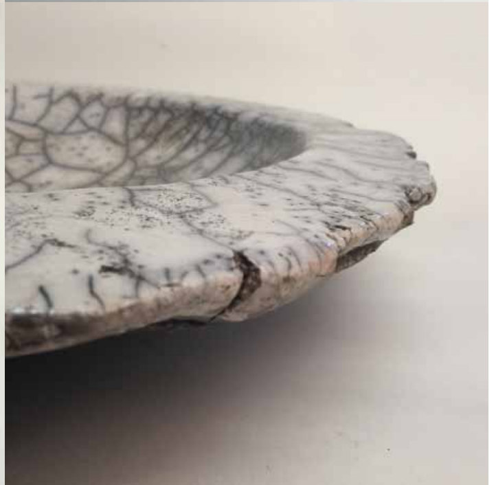
Cornelia Nagel Schale / Bowl , various views 2010, ca. 8,7 x 42,3 x 42,3 cm Raku fired ware, 1000° C, oxide, transparent glazing