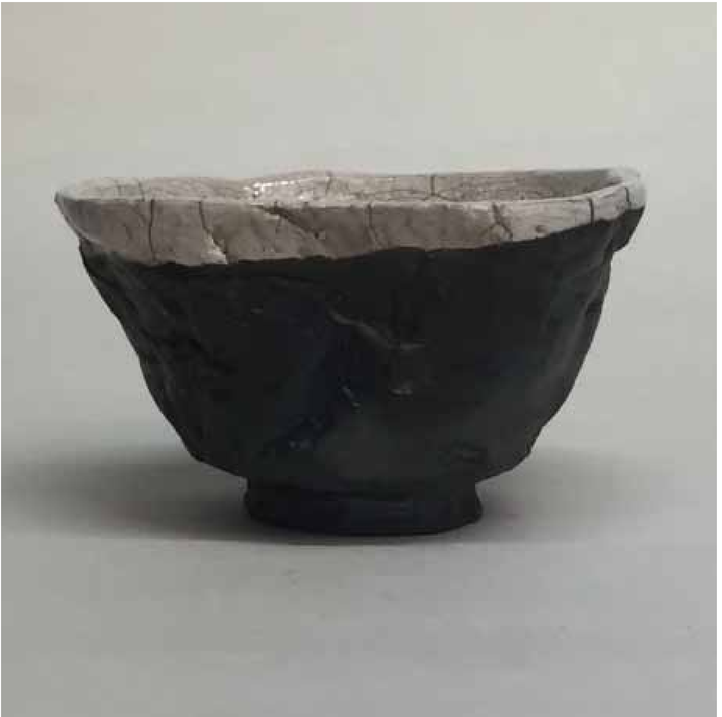
Cornelia Nagel Tee im Mai / Tea in May 2015, ca. 7,7 x 11,4 x 13 cm Raku fired ware, 1000° C, oxide, transparent glazing