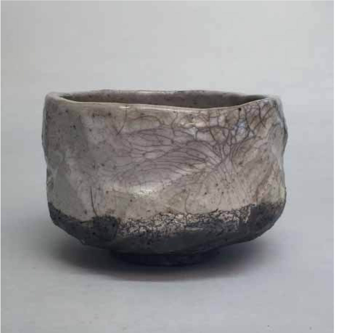
Cornelia Nagel Winterteeschale / Winter Tea Bowl 2014, ca. 8,4 x 13 x 12,7 cm Raku fired ware, 1000° C, oxide, transparent glazing