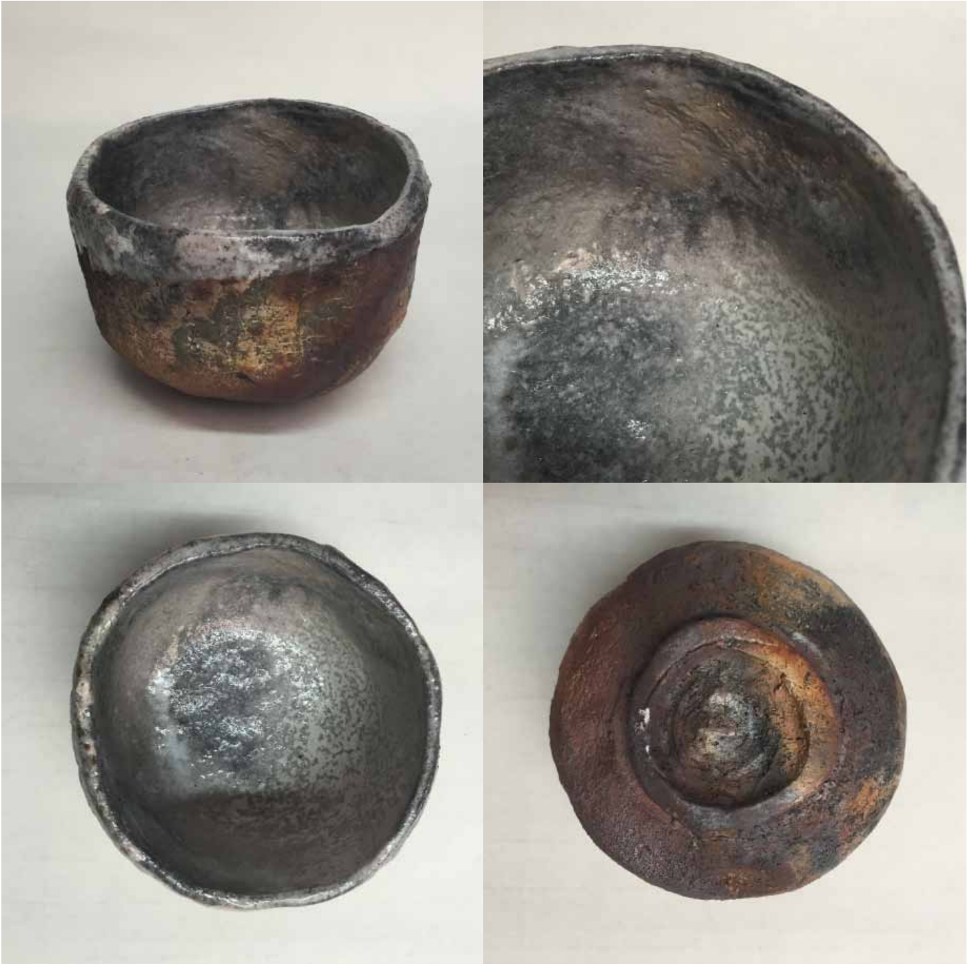
Cornelia Nagel Tee im April / Tea in April , various views 2016, ca. 8,4 x 12,6 x 12,6 cm Raku fired ware, 1000° C, oxide, transparent glazing