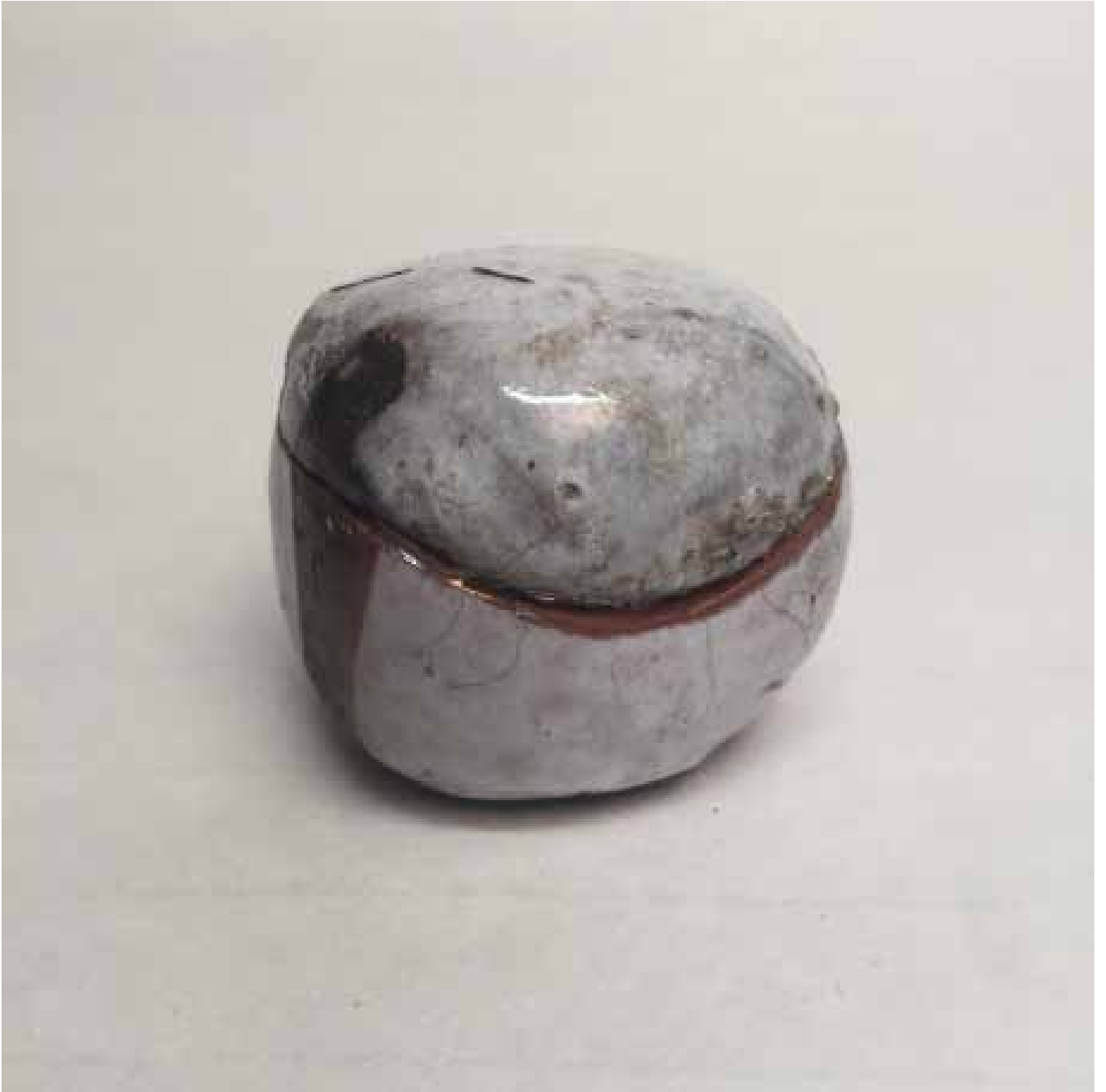
Cornelia Nagel Dose (klein) / Box (small) 2010, ca. 4,7 x 5,3 x 5,6 Raku fired ware, 1000° C, covering glazing