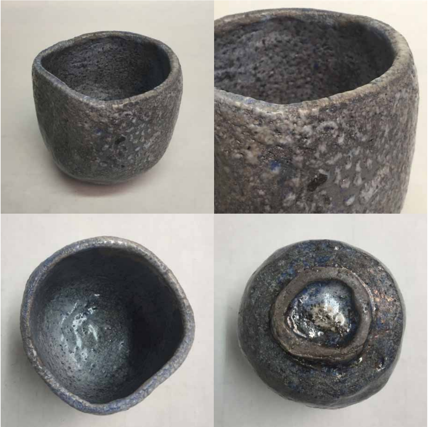
Cornelia Nagel Tee im zum Handewärmen / Tea for Handwarming 1996, ca. 9,6 x 9,4 x 9,7 cm Raku fired ware, 1000° C, oxide, cobalt glazing