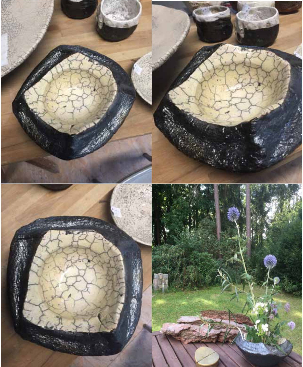
Cornelia Nagel Schale / Bowl , various views 2007, ca. 9,3 x 22,2 x 20 cm Raku fired ware, 1000° C, oxide, transparent glazing