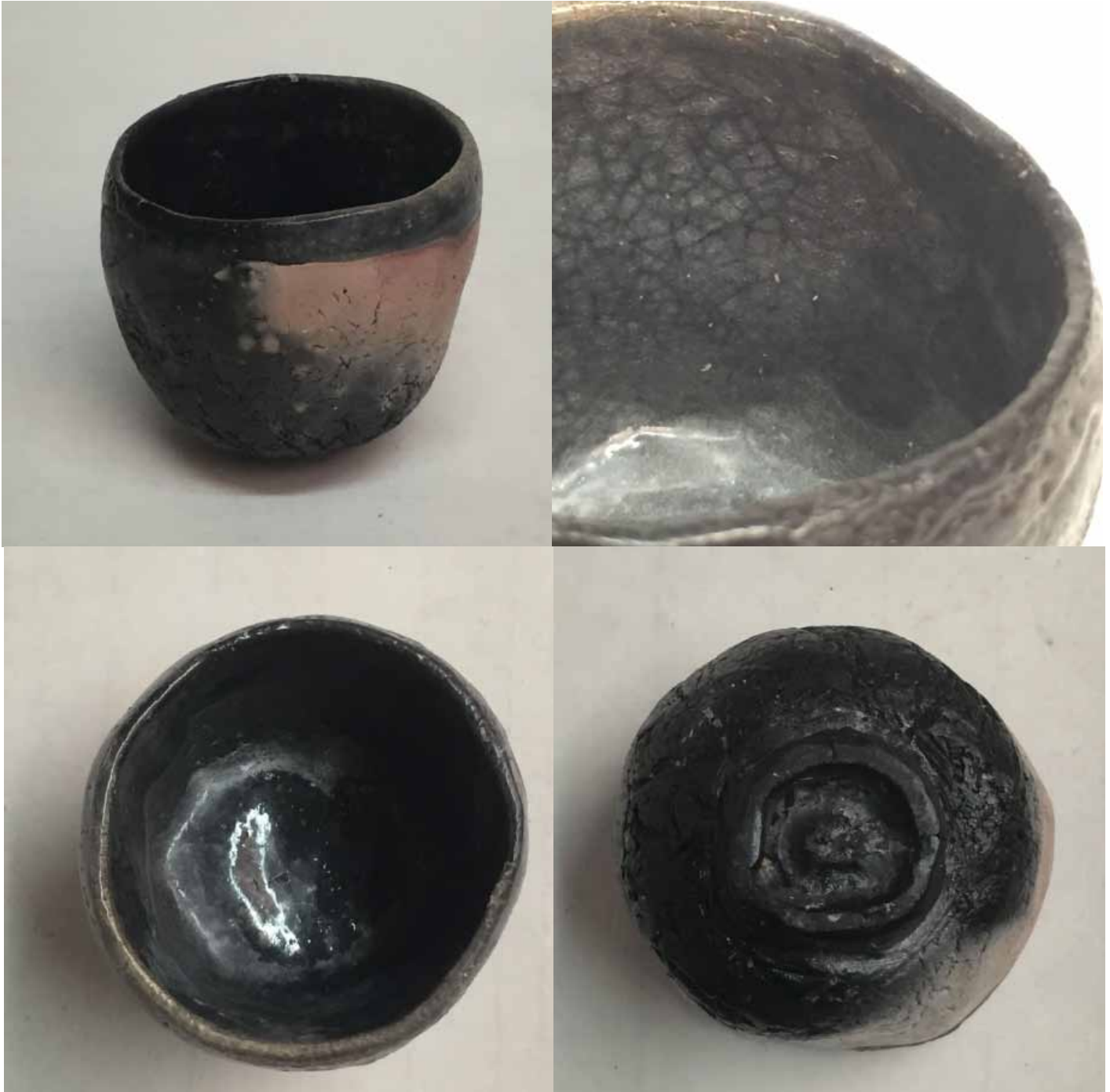
Cornelia Nagel Kleiner Teebecher / Small Teacup, various views 2006, ca. 6,5 x 6,5 x 7 cm Raku fired ware, 1000° C, oxide, semi-transparent glazing