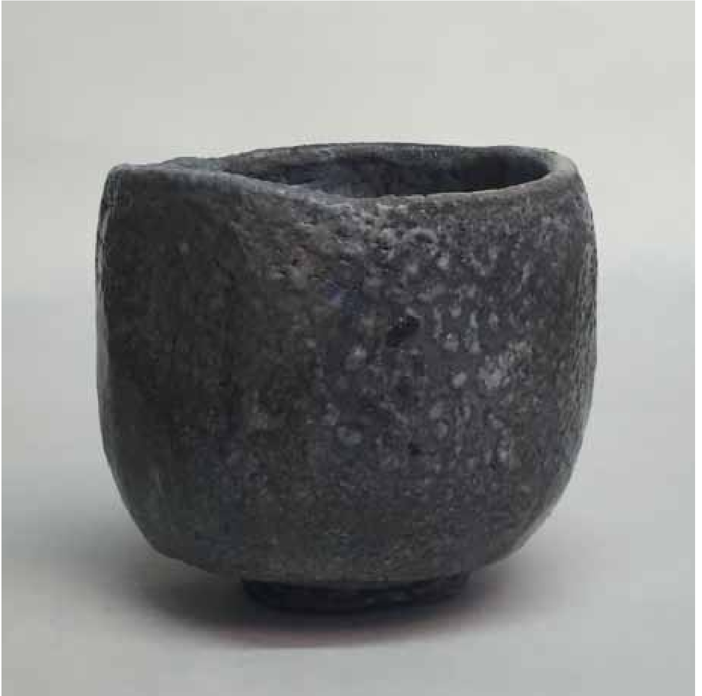
Cornelia Nagel Tee im zum Handewärmen / Tea for Handwarming 1996, ca. 9,6 x 9,4 x 9,7 cm Raku fired ware, 1000° C, oxide, cobalt glazing