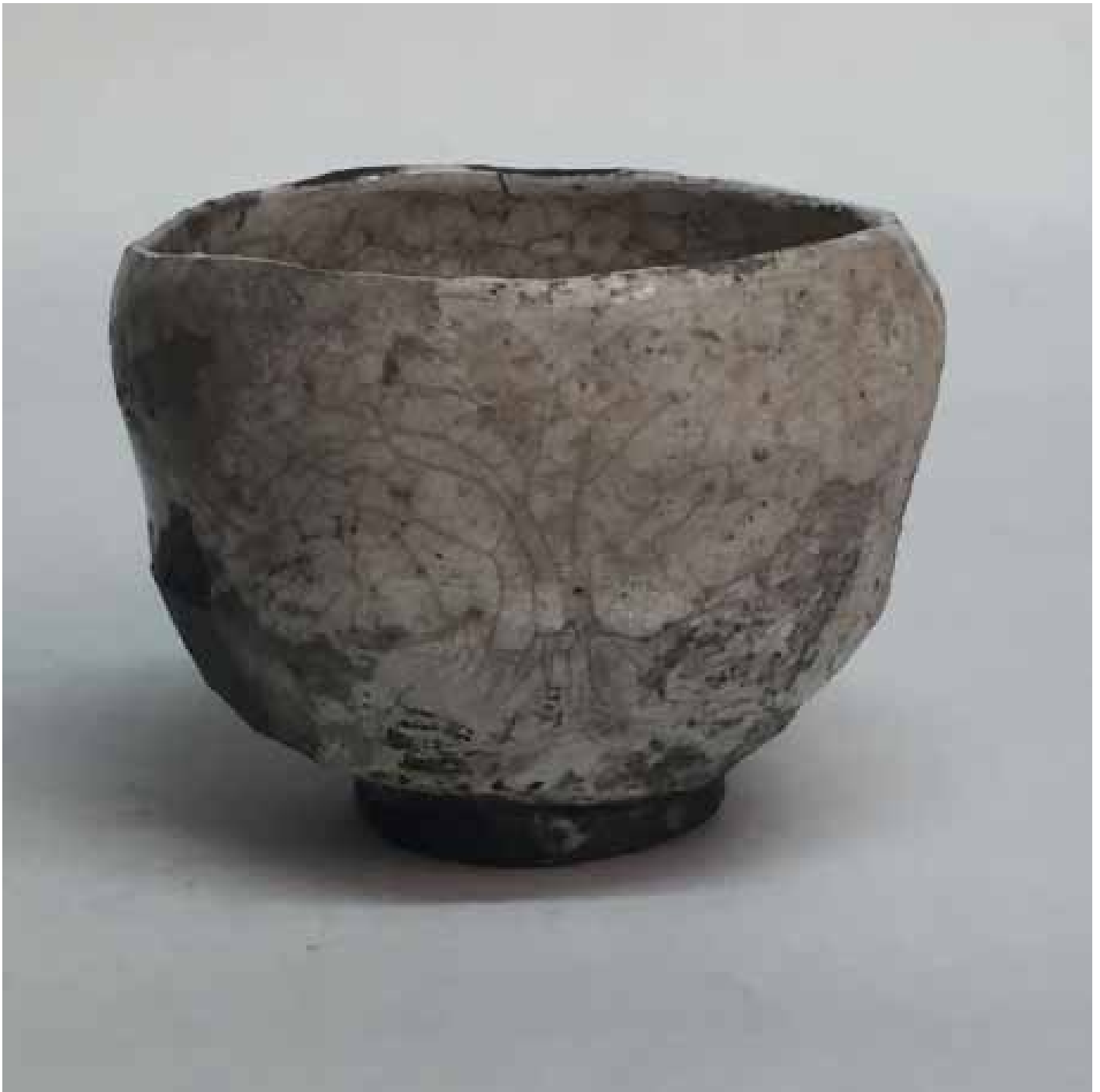
Cornelia Nagel Tee im März / Tea in March 2015, ca. 7,4 x 9,2 x 9,4 cm Raku fired ware, 1000° C, oxide, transparent glazing