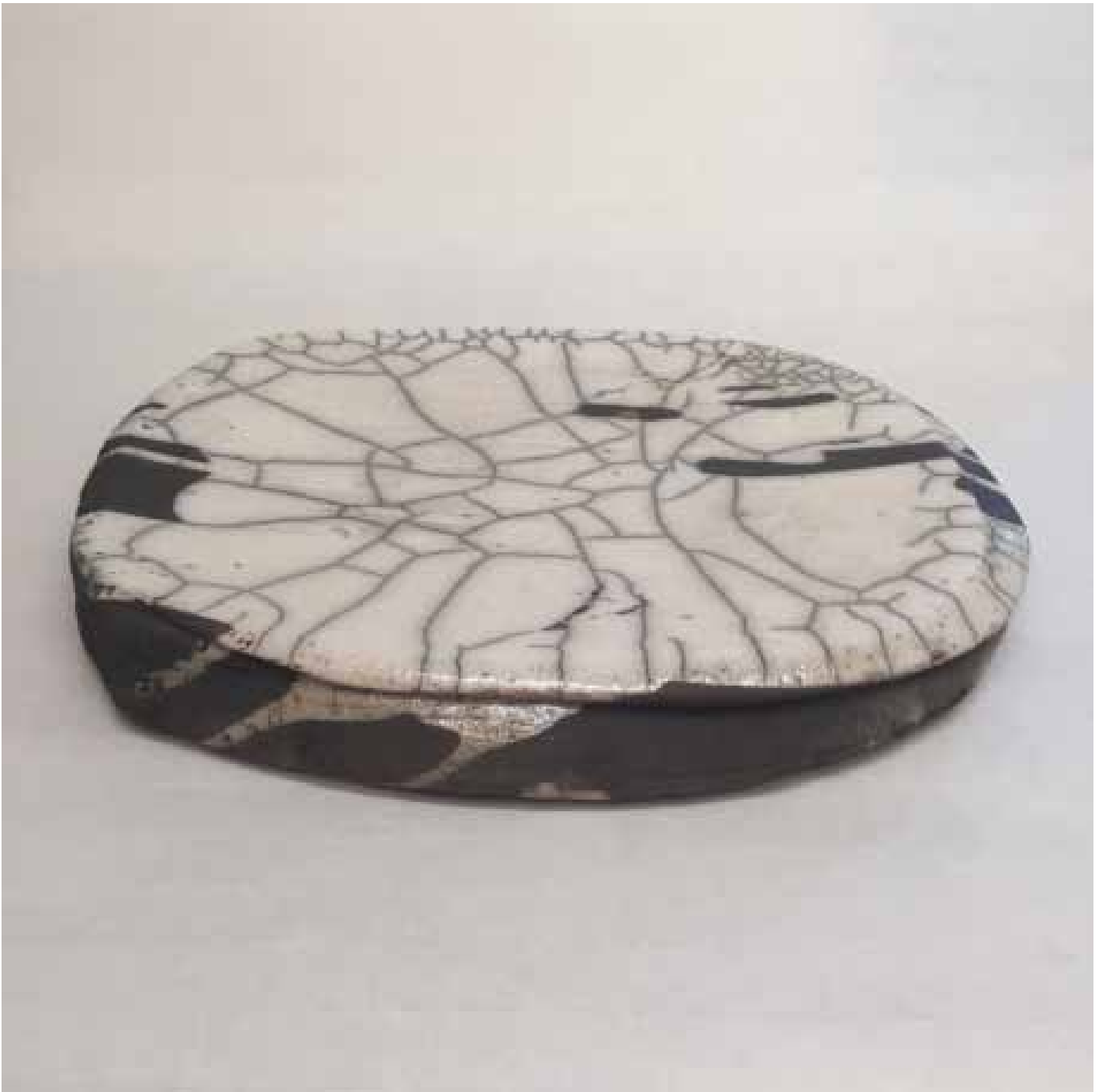
Cornelia Nagel Schale (Platte) / Bowl (disk) 2012, ca. 4 x 34,2 x 30,7 cm Raku fired ware, 1000° C, oxide, transparent glazing