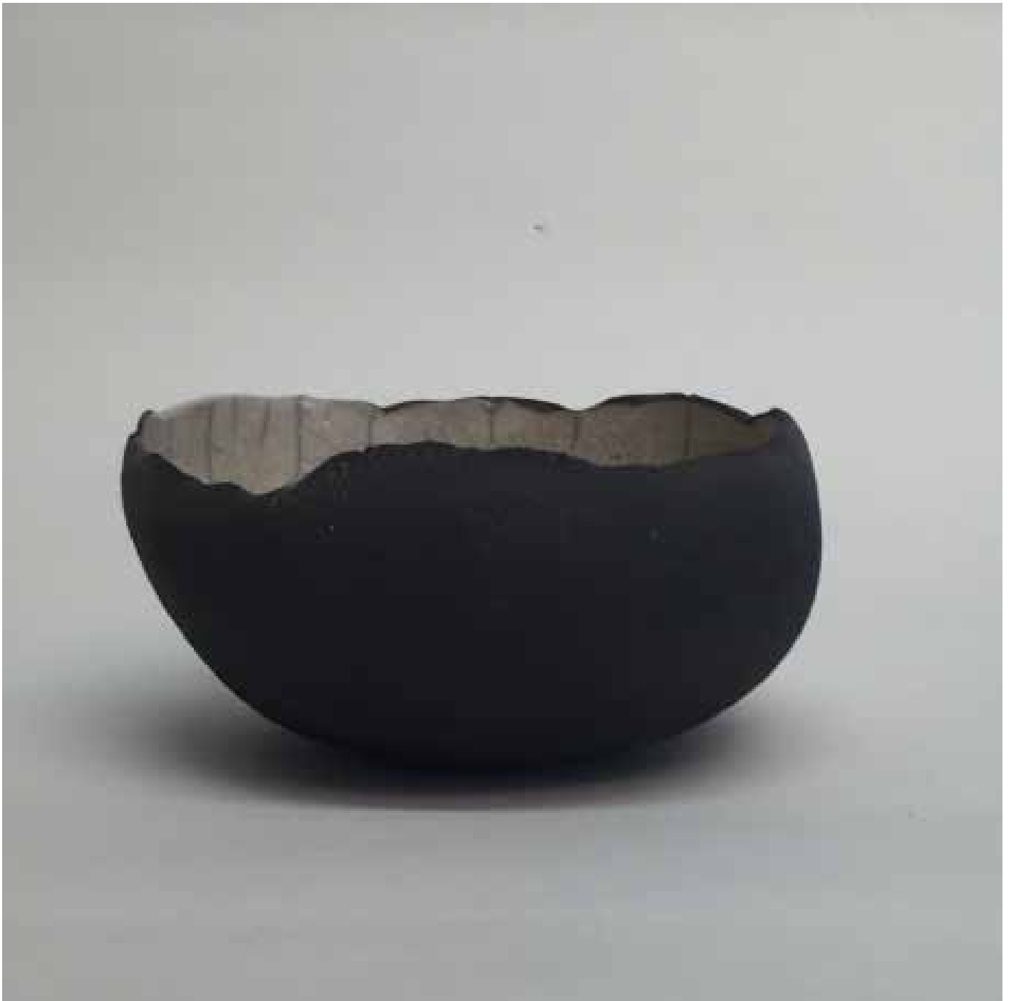
Cornelia Nagel Aus der Serie 100 Schalen / From the Series 100 Bowls 1997/98, ca. 8 x 16 x 15,5 cm Raku fired ware, 1000° C, oxide, transparent glazing