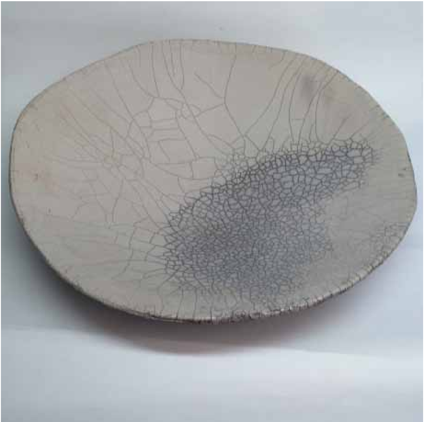
Cornelia Nagel Schale / Bowl 1996, ca. 13,5 x 52,2 x 51 cm Raku fired ware, 1000° C, oxide, transparent glazing