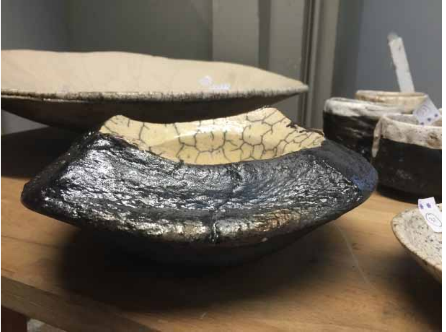
Cornelia Nagel Schale / Bowl 2007, ca. 9,3 x 22,2 x 20 cm Raku fired ware, 1000° C, oxide, transparent glazing