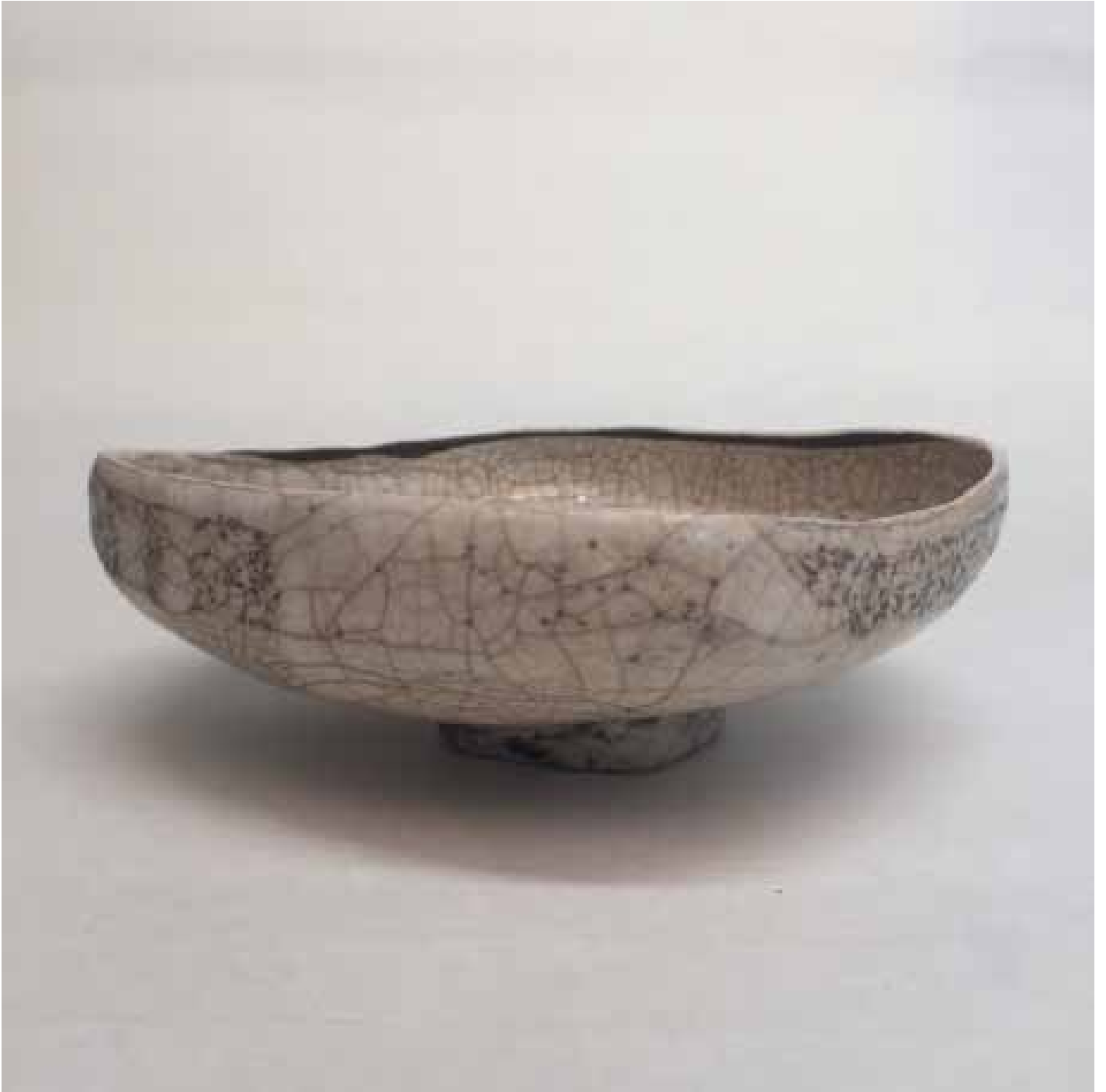
Cornelia Nagel Schale für den Sommertee / Bowl for the Summer Tea 2000, ca. 5,3 x 14,4 x 14,5 cm Raku fired ware, 1000° C, oxide, transparent glazing