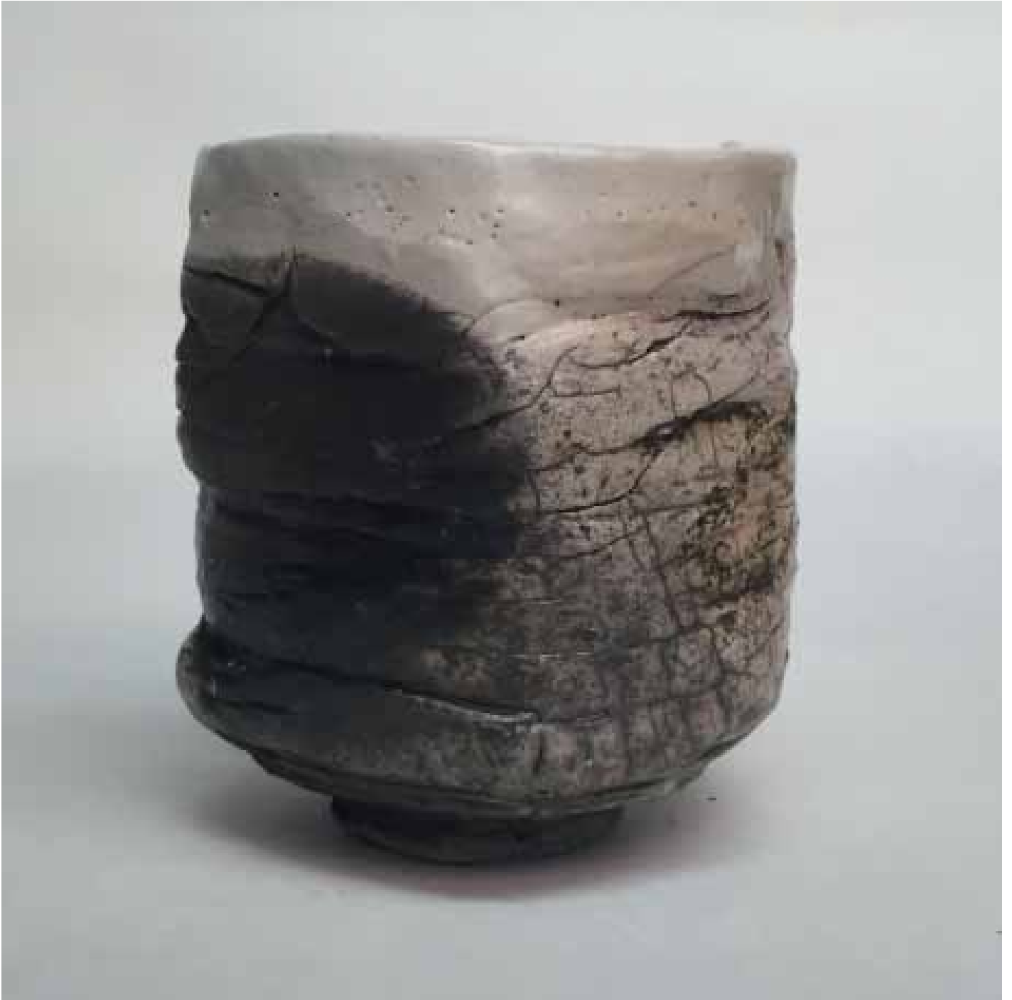
Cornelia Nagel Teebecher / Teamug 2014, ca. 10,4 x 9,4 x 8,9 cm Raku fired ware, 1000° C, oxide, semi-transparent glazing