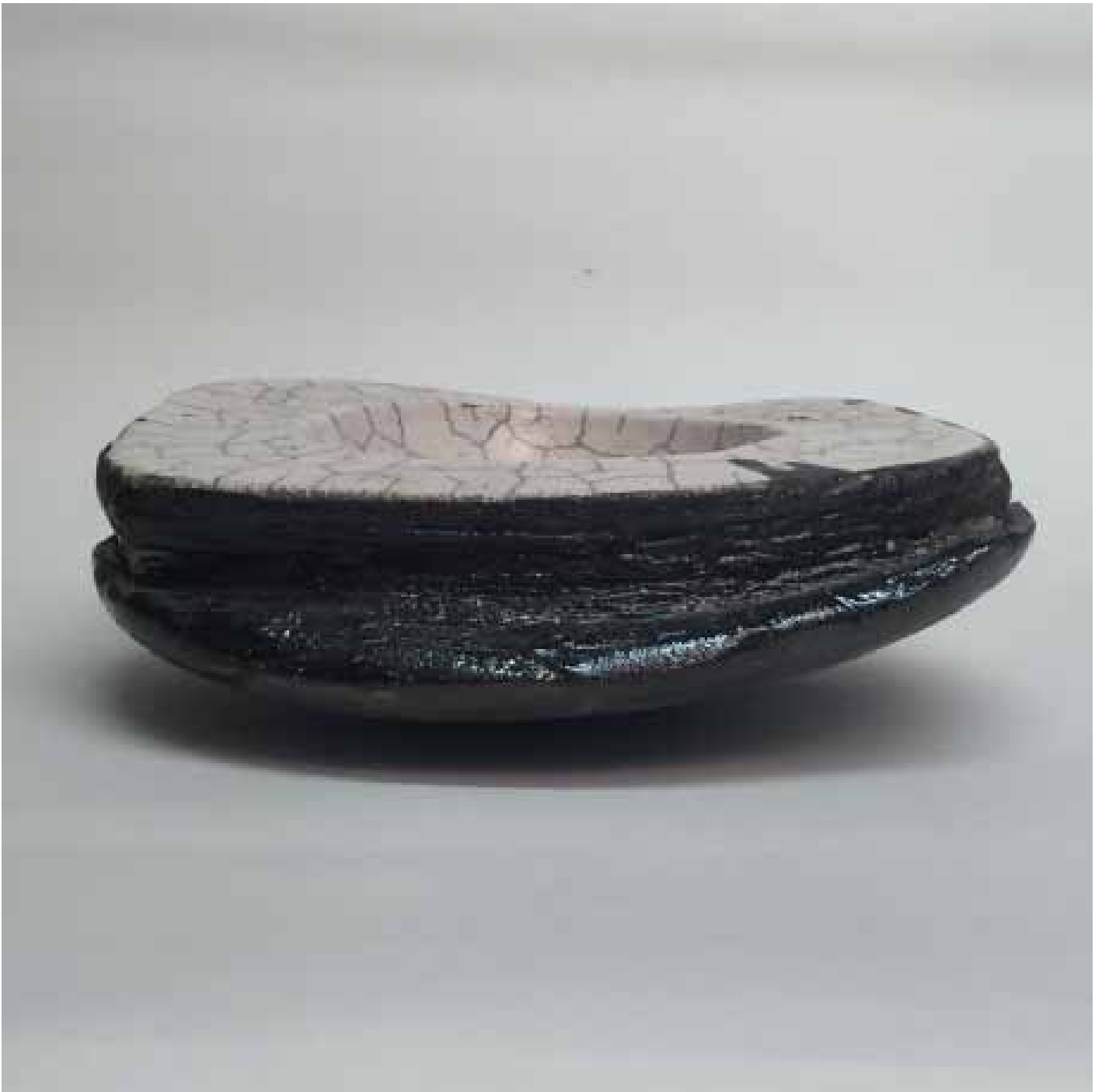
Cornelia Nagel Schale / Bowl 2010, ca. 8 x 24,7 x 23 cm Raku fired ware, 1000° C, oxide, transparent glazing