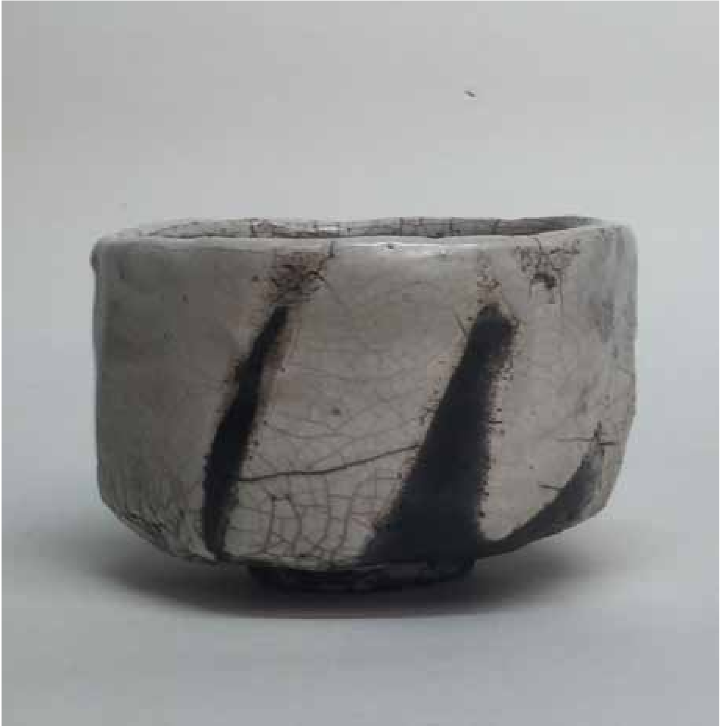
Cornelia Nagel Winterteeschale / Winter Tea Bowl 2006, ca. 8,2 x 12,5 x 12,3 cm Raku fired ware, 1000° C, oxide, transparent glazing