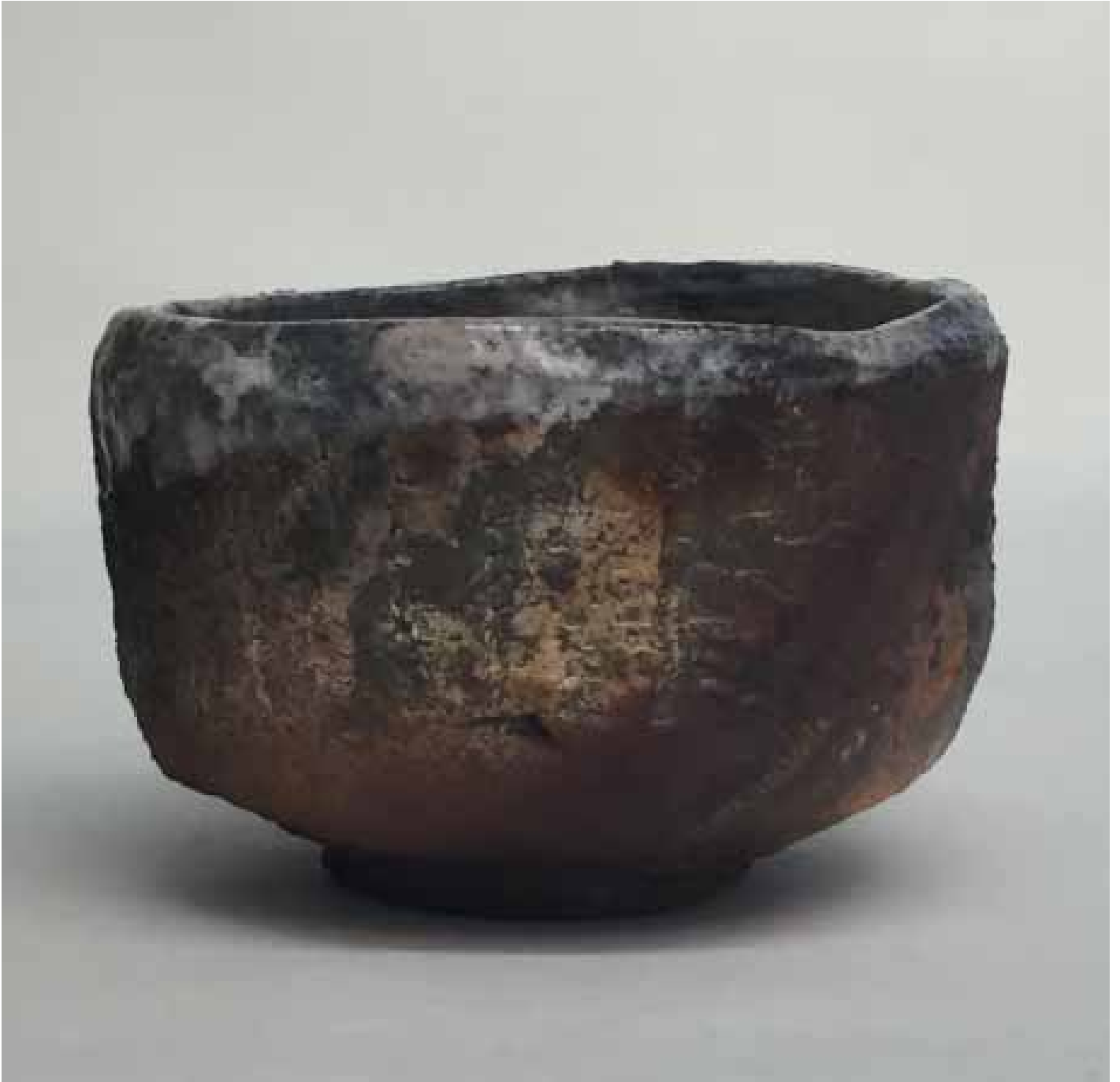
Cornelia Nagel Tee im April / Tea in April 2016, ca. 8,4 x 12,6 x 12,6 cm Raku fired ware, 1000° C, oxide, transparent glazing