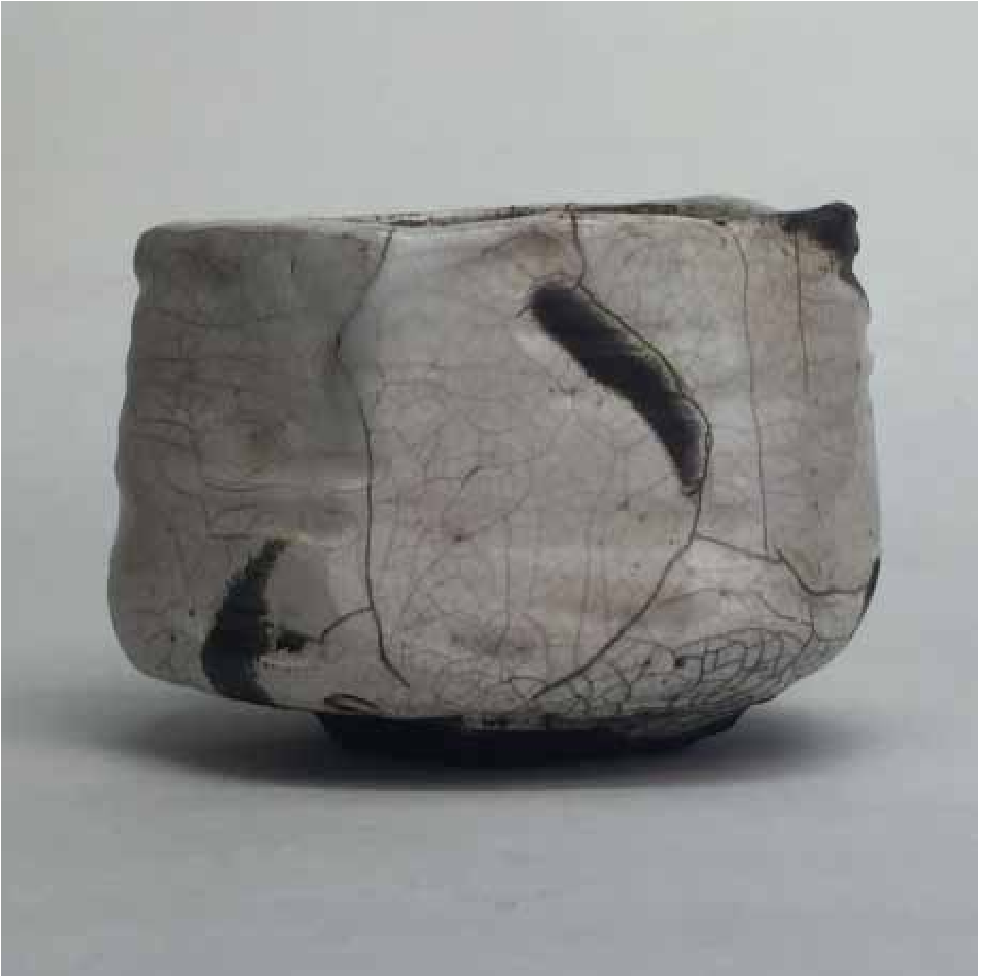
Cornelia Nagel Winterteeschale / Winter Tea Bowl 2014 ca. 9 x 12,2 x 11,8 cm Raku fired ware, 1000° C, oxide, transparent glazing