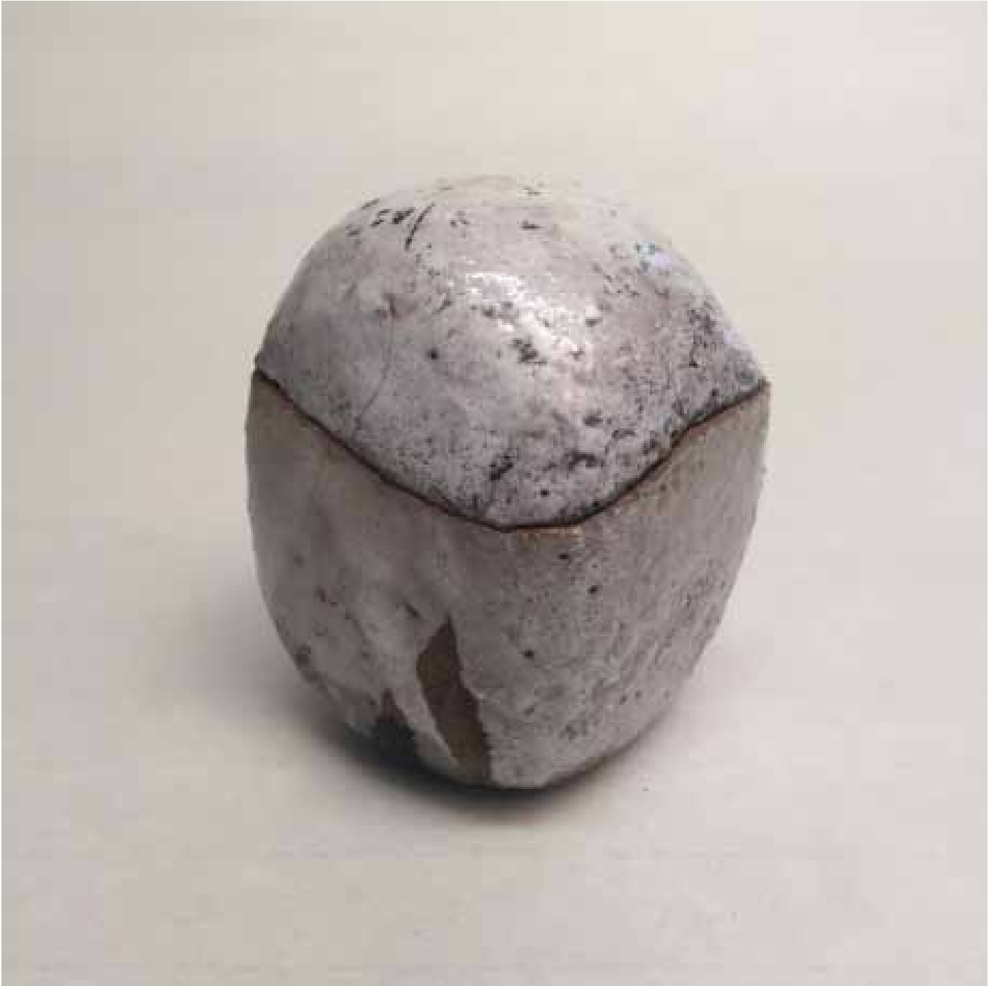
Cornelia Nagel Dose (klein) / Box (small) 2010, ca. 8 x 6,3 x 6,3 cm Raku fired ware, 1000° C, covering glazing