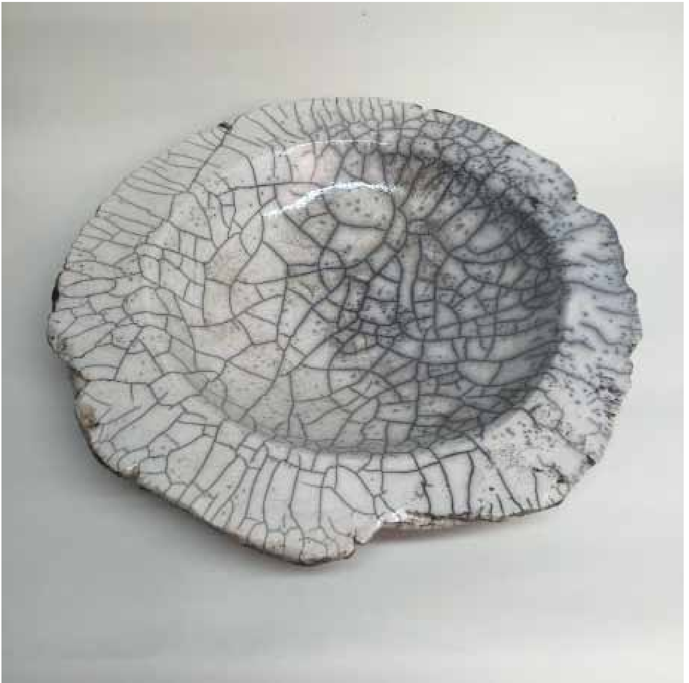
Cornelia Nagel Schale / Bowl 2010, ca. 8,7 x 42,3 x 42,3 cm Raku fired ware, 1000° C, oxide, transparent glazing