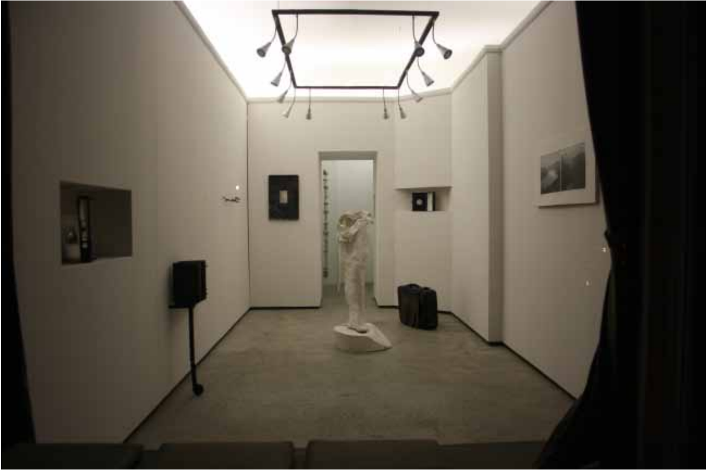
Nataly Hocke Ausstellungsansicht Intervention XXXI KioskShop berlin Frühjahr 2011