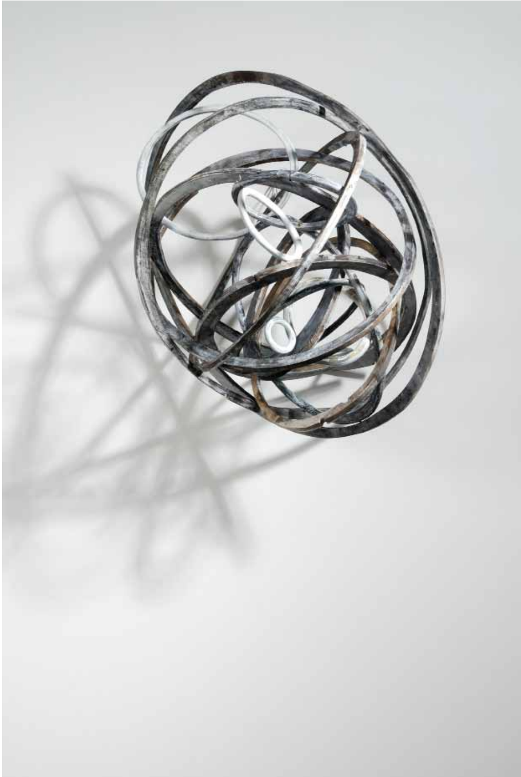
Nataly Hocke Umlaufbahn 2012, 67 x 55 x 65 cm Holz, Farbe