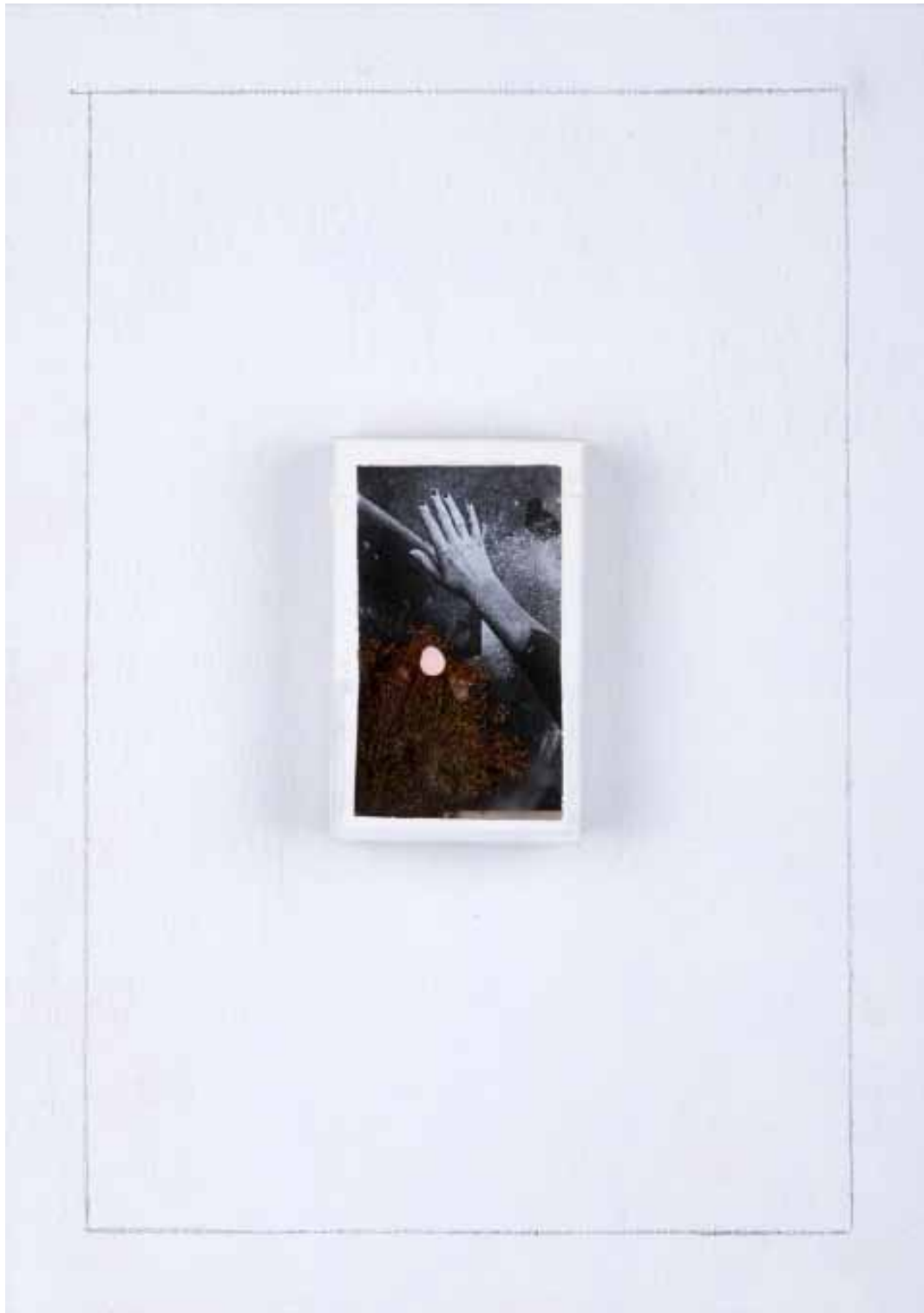
Nataly Hocke Moonwalk Nr.2 2014, 29,6 x 21 cm Fotografie (Handabzug), Mixed Media