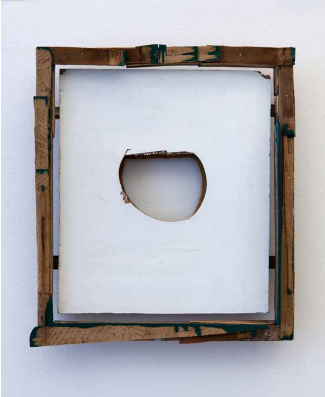
Nataly Hocke Echo 2015, 43 x 38 cm, Holz, Spanholz, Binderfarbe