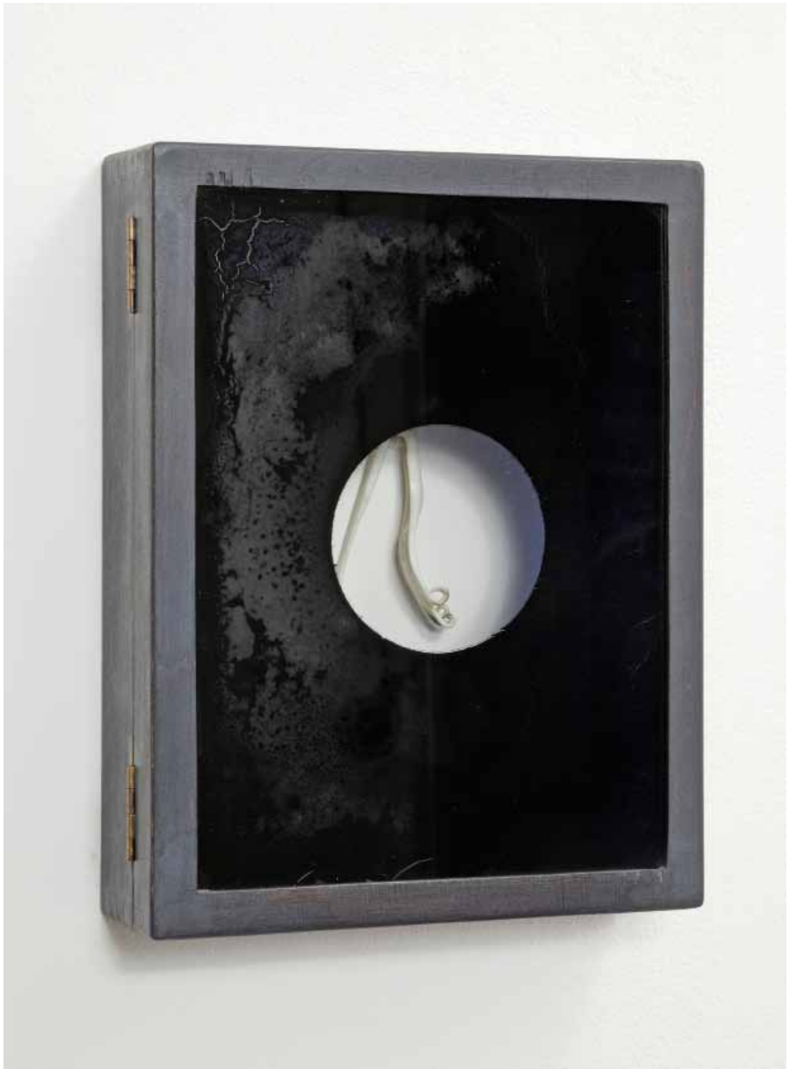
Nataly Hocke Mysterious Fork 2007, 25 x 19,7 x 6 cm Holz, Glas, Farbe, Kunststoff