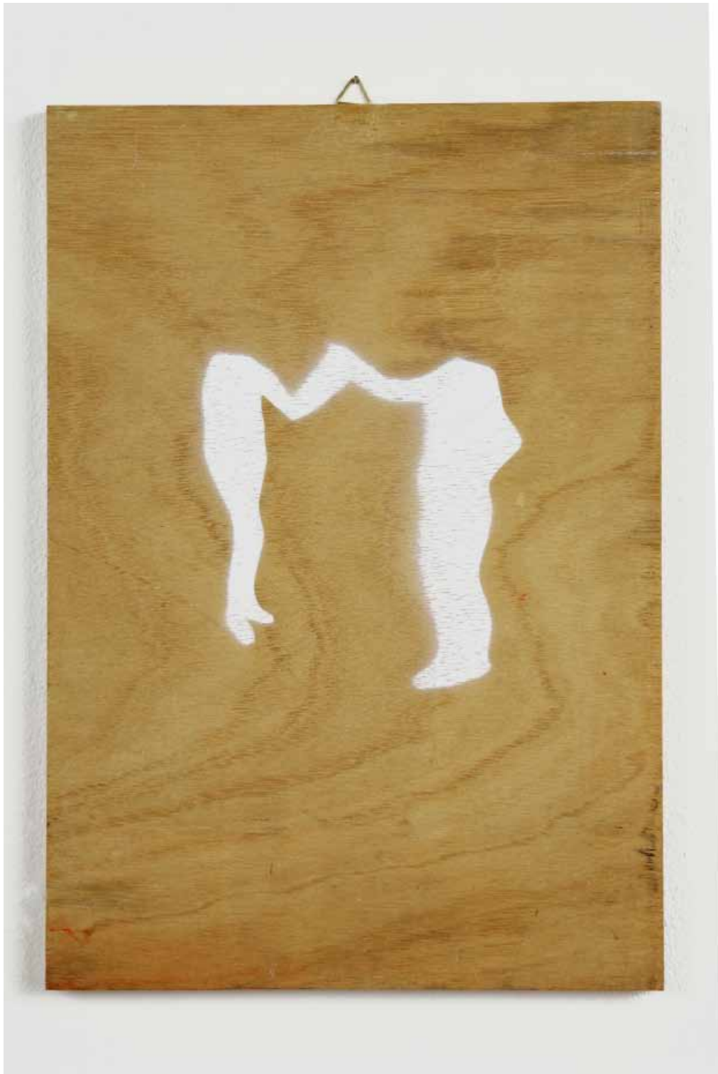
Nataly Hocke Handreichung 2011, 34 x 24 x 1 cm Binderfarbe auf Holz