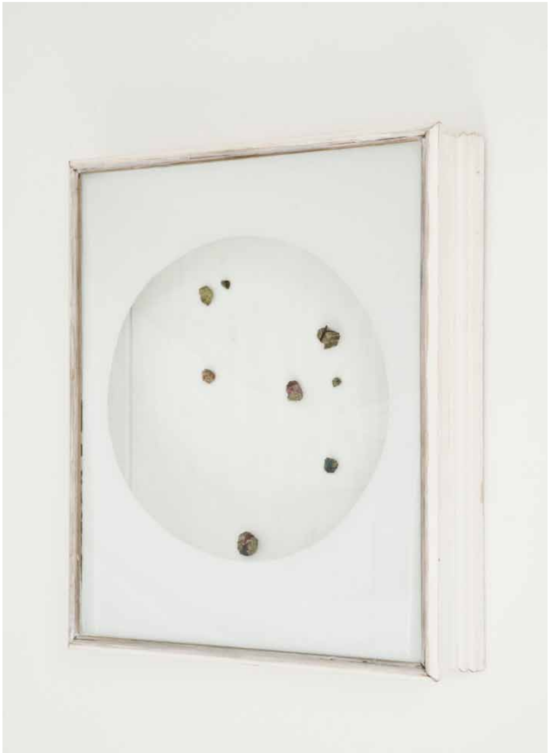
Nataly Hocke Welterbe 2010, 53 x 56 x 24 cm Holz, Glas, Farbe, Tuffstein