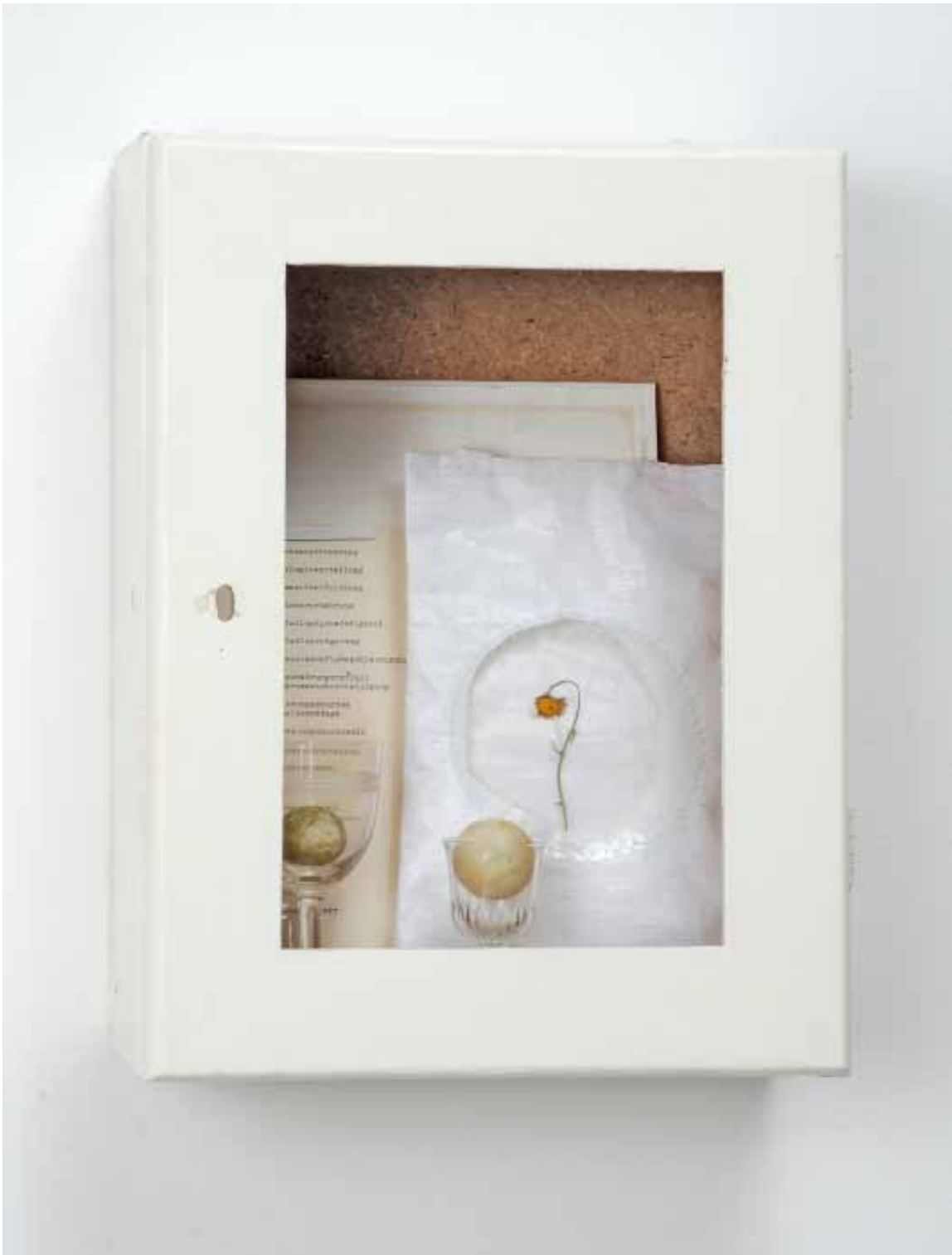
Nataly Hocke Trilogieverteilung 2012, 42 x 31,5 x 16,5 cm Holz, Glas, Text, Kunststoff