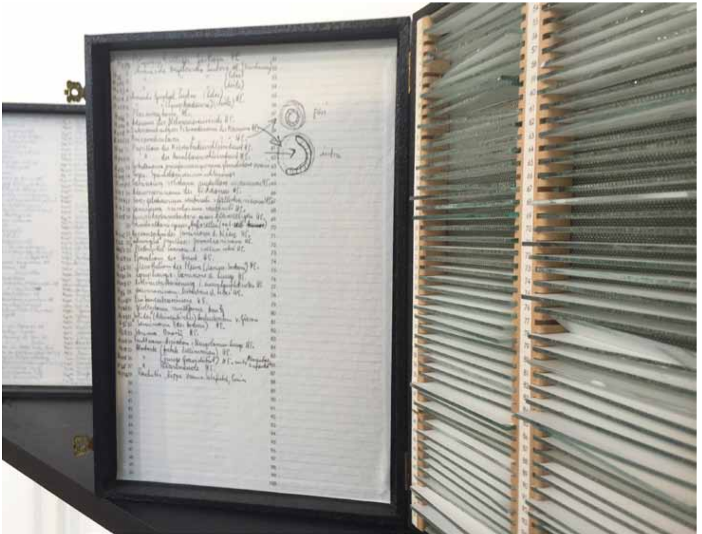
Nataly Hocke Assistent (Detail) 2011, 91,5 x 91,5 x 21 cm, Holz, Archivkästen, Glas, Farbe