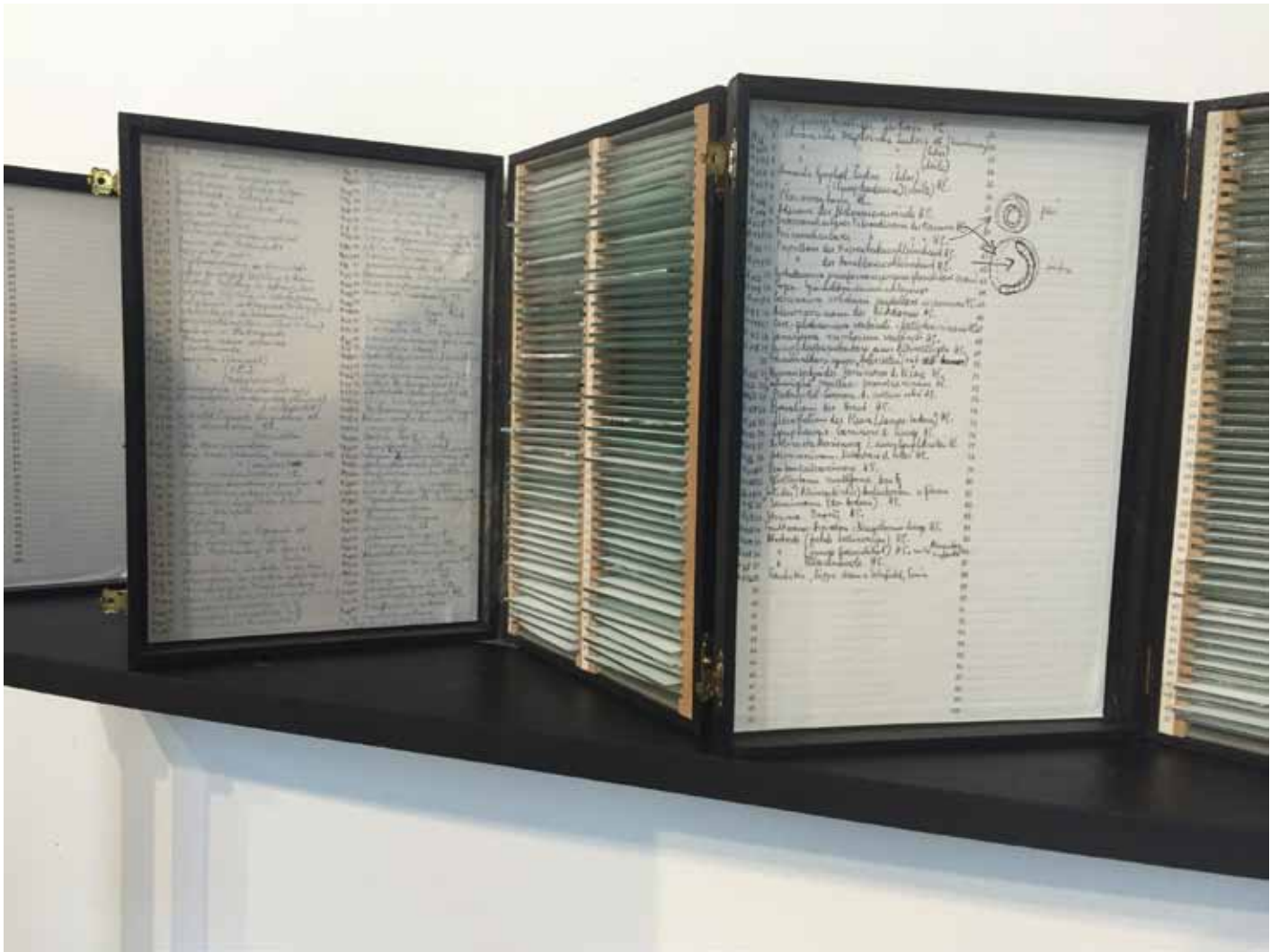
Nataly Hocke Assistent (Detail) 2011, 91,5 x 91,5 x 21 cm, Holz, Archivkästen, Glas, Farbe