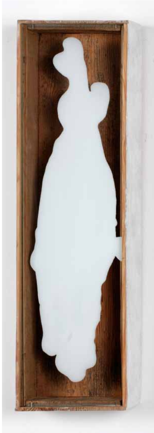
Nataly Hocke Großer blinder Fleck 2007, 59 x 18 x 8 cm Holz, Glas, Wandfarbe, Ölfarbe