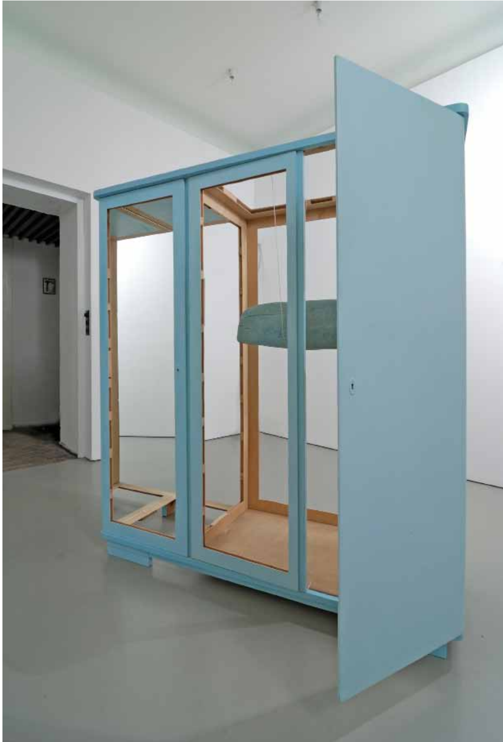
Nataly Hocke Flippers Kindheit 2007, 176 x 157 x 58 cm Holz, Spiegel, Farbe, Schnur, Metall