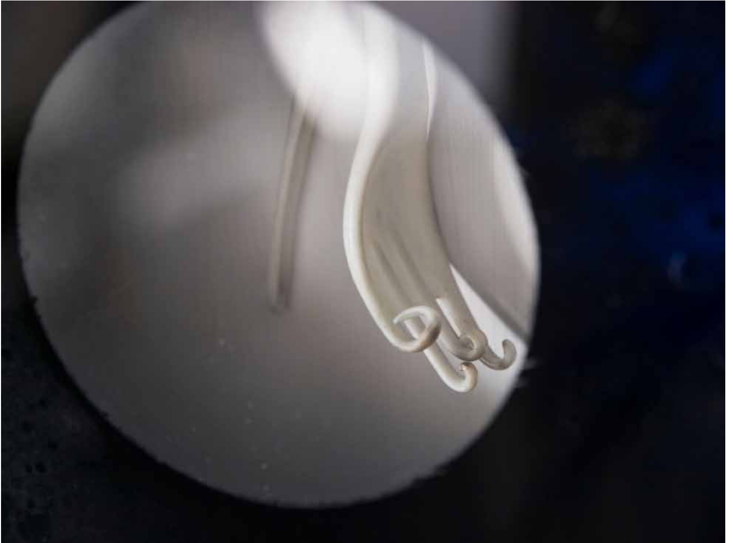
Nataly Hocke Gabel 2007, 5 x 19,5 x 6 cm Holz, Glas, Farbe, Kunststoff