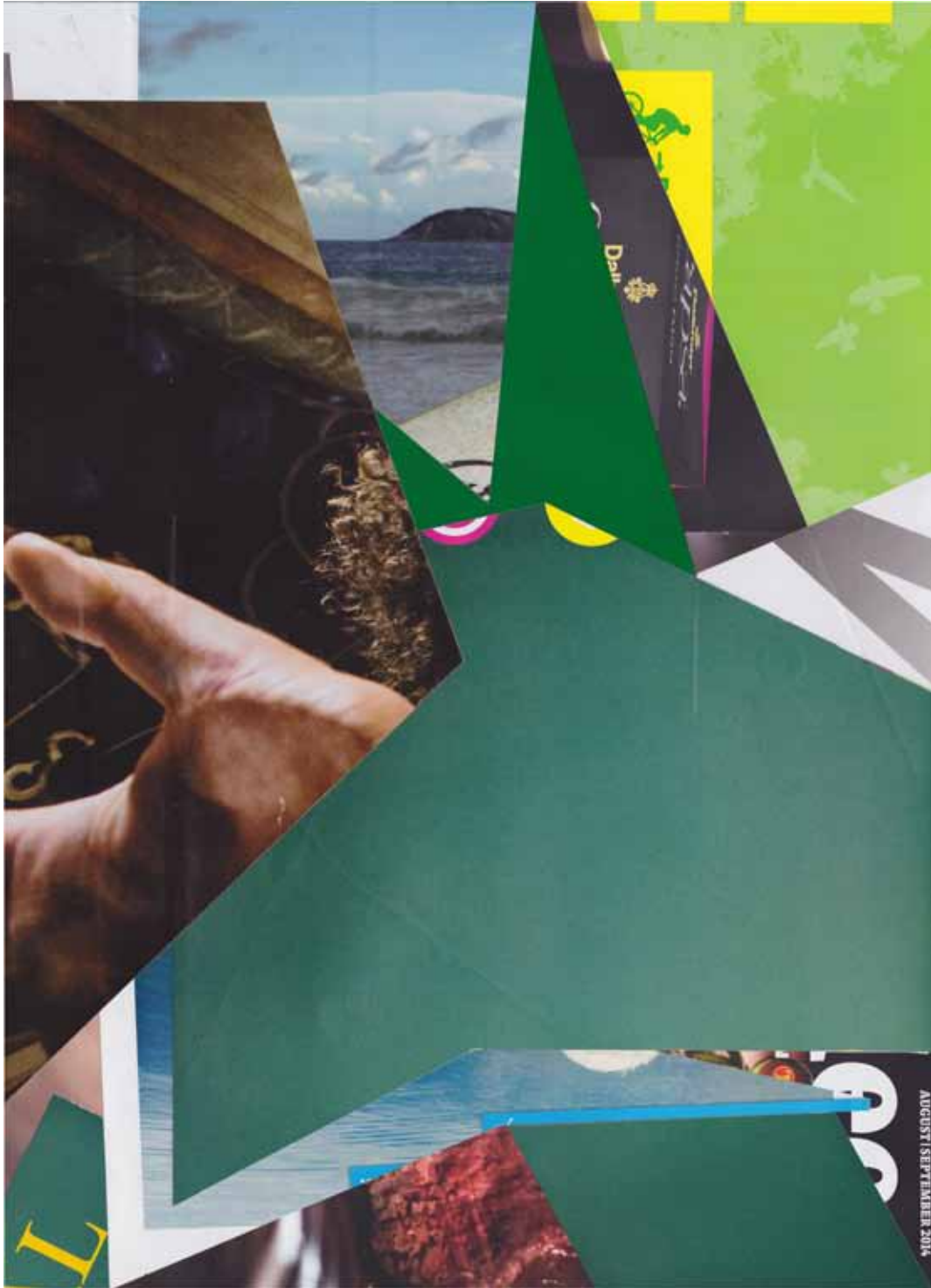
Marc von der Hocht Spike Nr. 3/15 (+3) 2014, 14,01 x 10,04 in. (35,6 x 25,5 cm), Mixed Media Gallery Edition