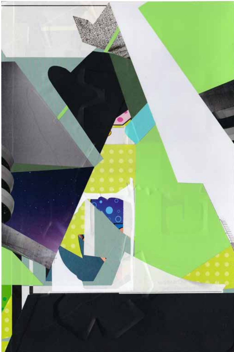
Marc von der Hocht Dapuqiao 2015, 8,86 x 13,35 in. (22,5 x 33,9) cm Mixed Media