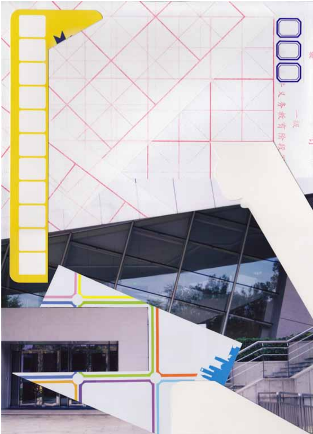
Marc von der Hocht Xintiandi Nr. 8/15 (+2) 2016, 13,78 x 9,84 in. (35 x 25 cm), Mixed Media Gallery Edition