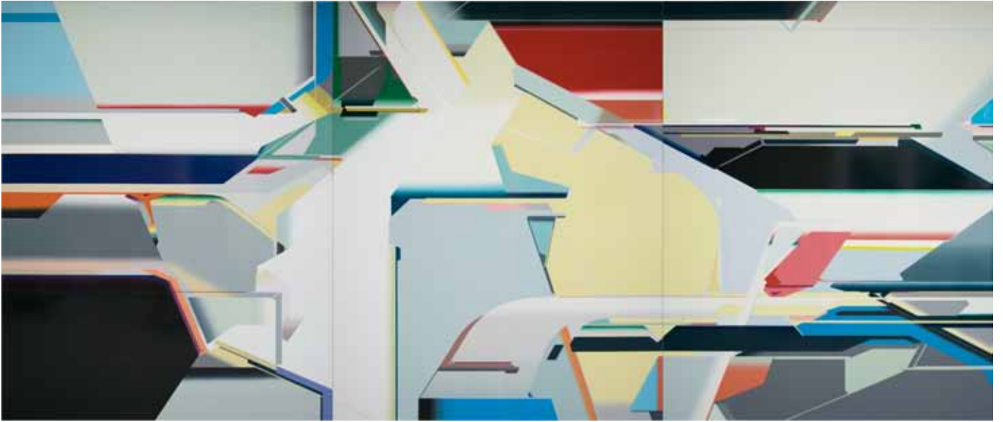
Marc von der Hocht Tick, Trick und Track 2016, 82,67 x 194,88 in. (210 x 495 cm), gloss enamel on cotton