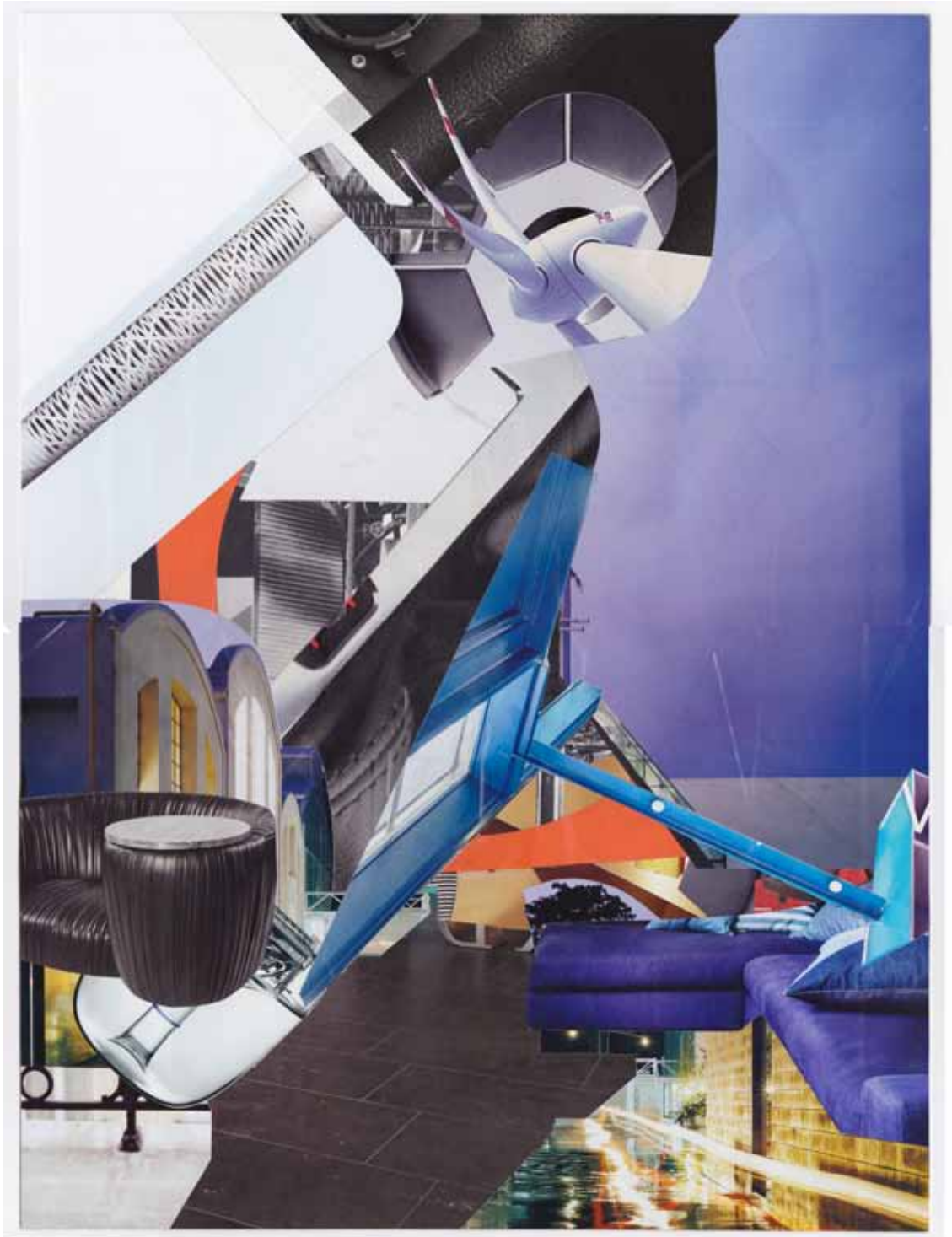
Marc von der Hocht Valvar 2015, 15,67 x 11,69 in. (39,8 x 29,7 cm) Mixed Media