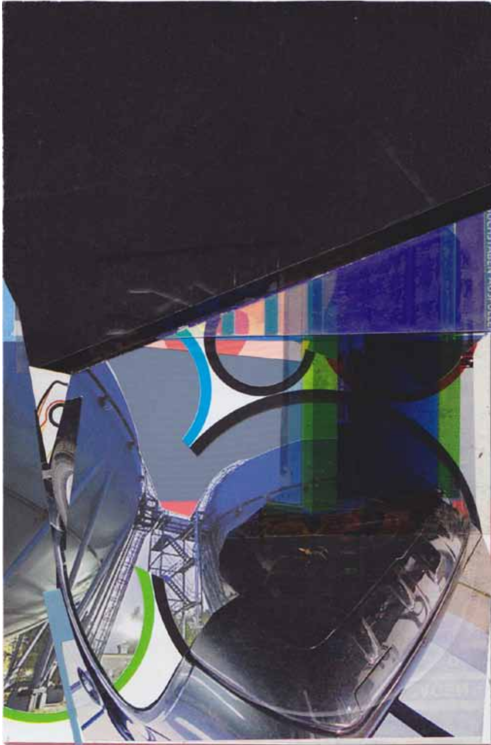
Marc von der Hocht Minica 2016, 5,79 x 3,82 in. (14,7 x 9,7 cm) Mixed Media