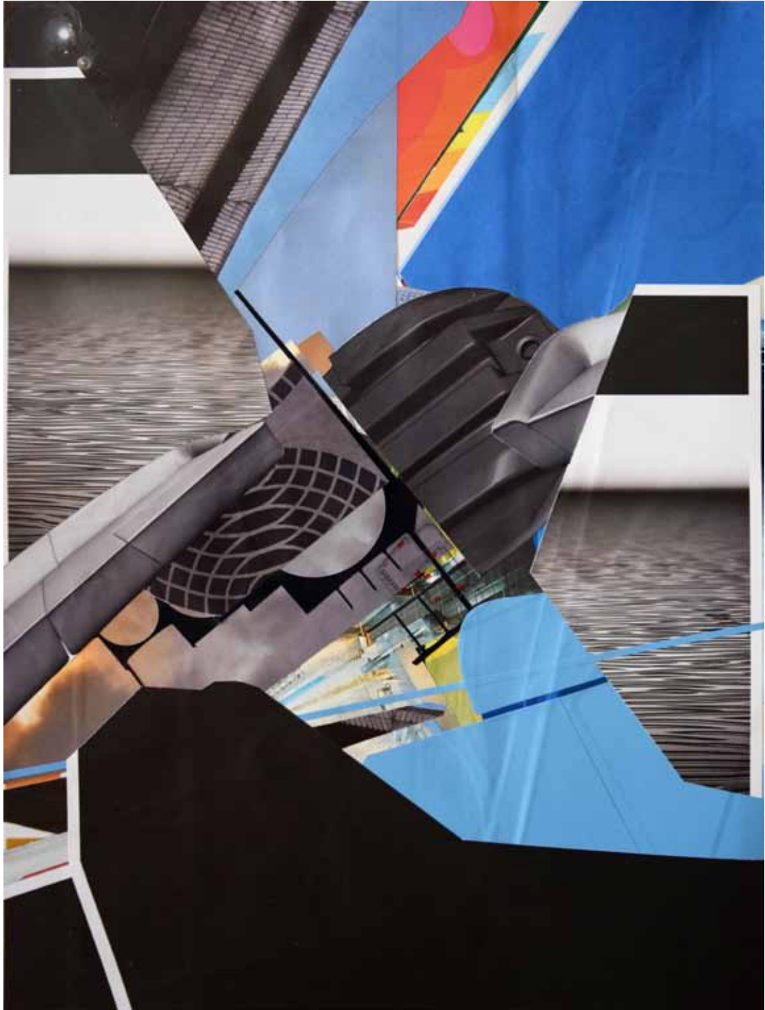
Marc von der Hocht Relay 2015, 15,63 x 11,69 in. (39,7 x 29,7 cm) Mixed Media

SEMJON CONTEMPORARY GALERIE FÜR ZEITGENÖSSISCHE KUNST