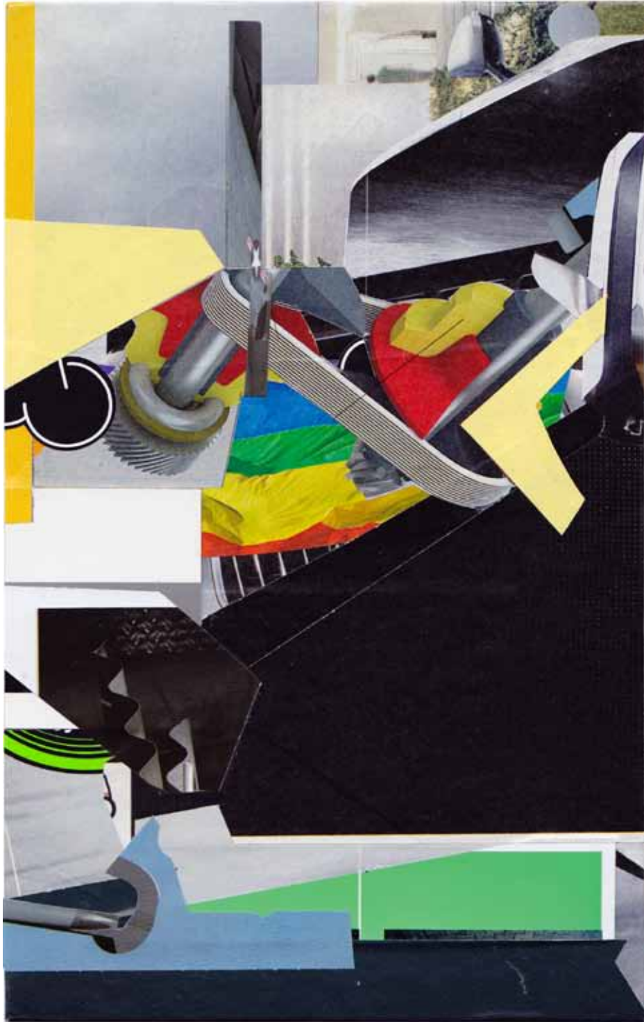
Marc von der Hocht Profile 2014, 7,28 x 4,53 in. (18,5 x 11,5 cm) Mixed Media