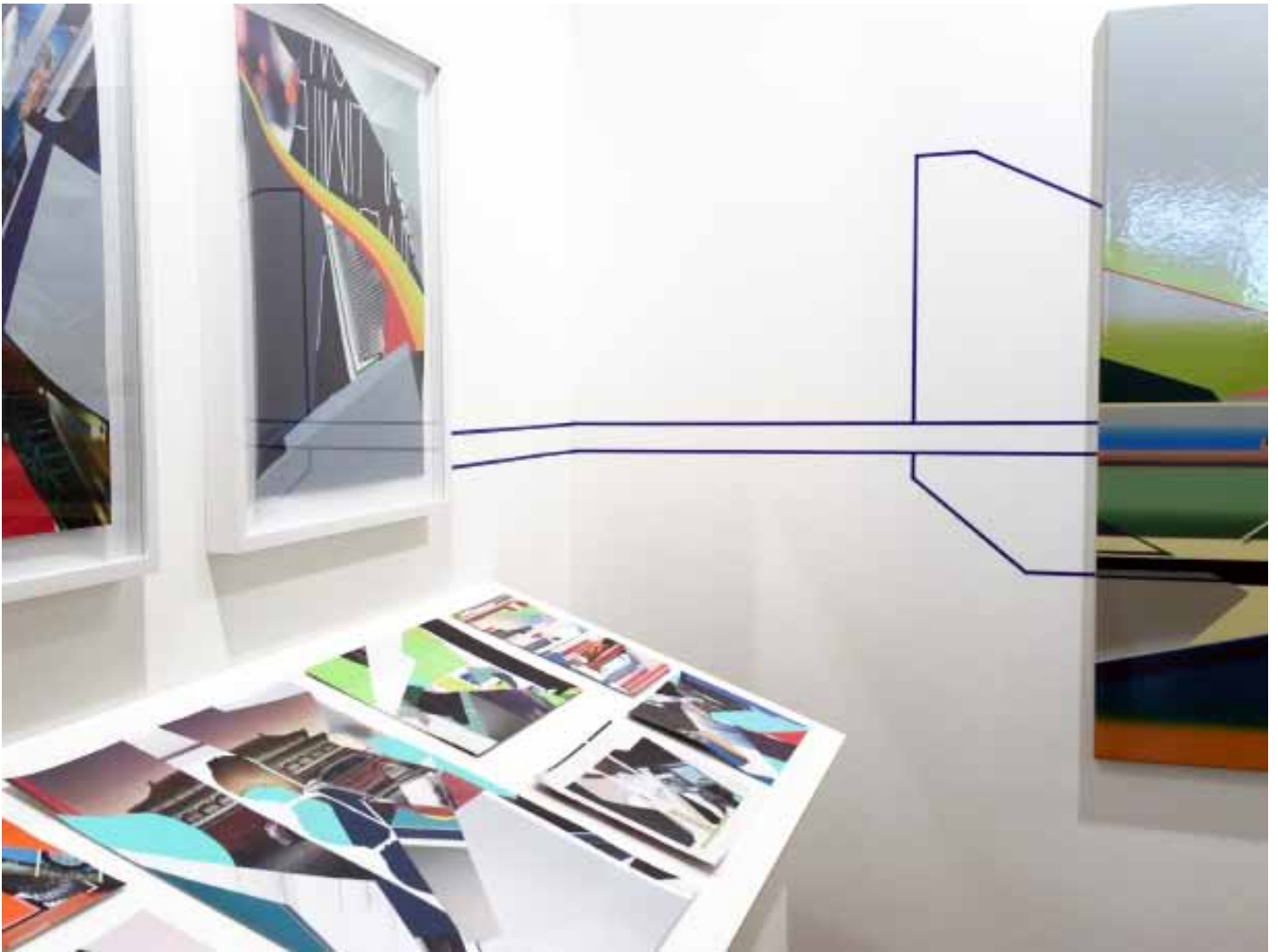
Marc von der Hocht Art Rotterdam 2016 View at the gallery stand with a solo booth by Marc von der Hocht