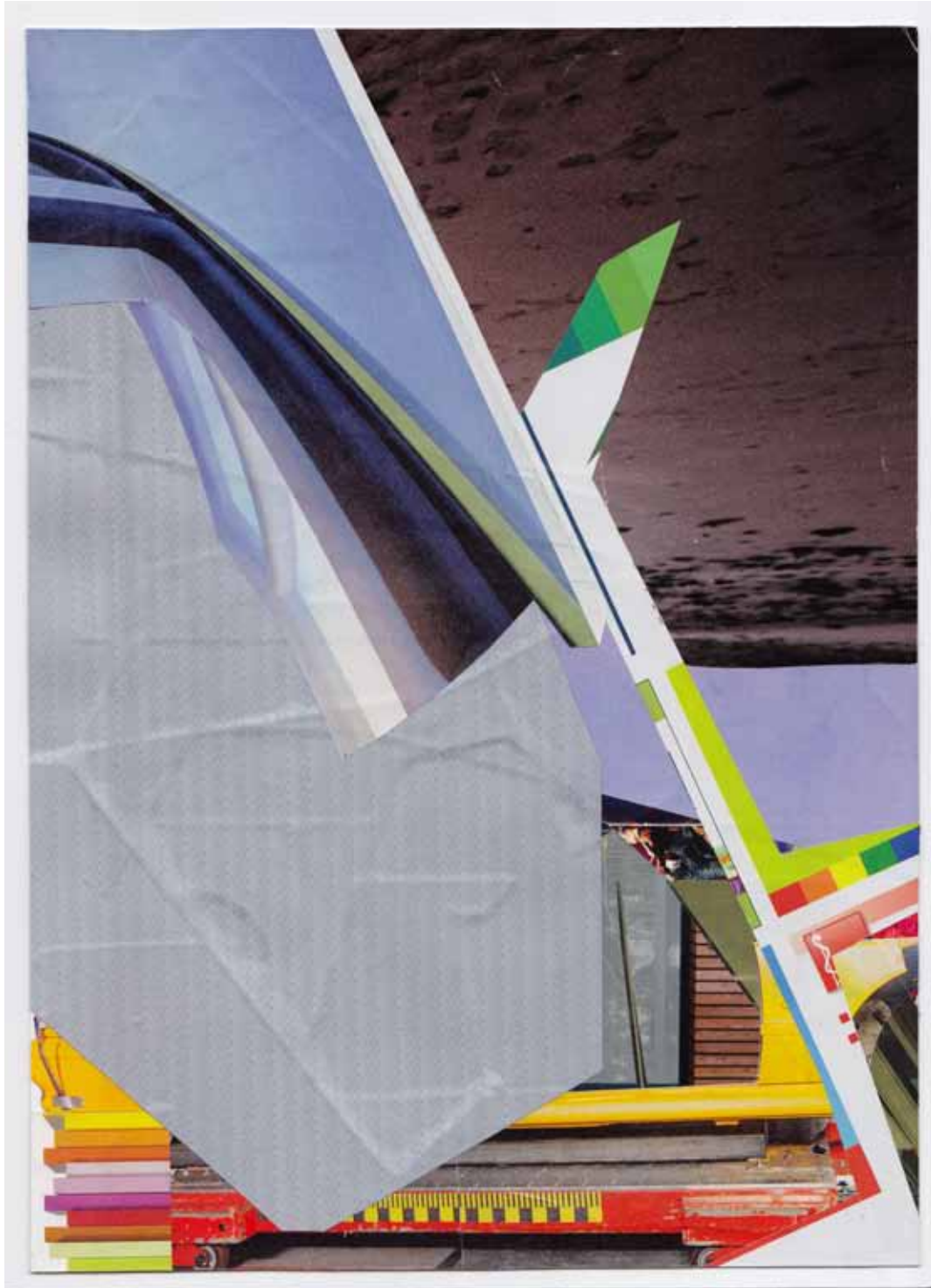
Marc von der Hocht Serc 2015, 10,98 x 7,87 in (27,9 x 20 cm) Mixed Media

SEMJON CONTEMPORARY GALERIE FÜR ZEITGENÖSSISCHE KUNST