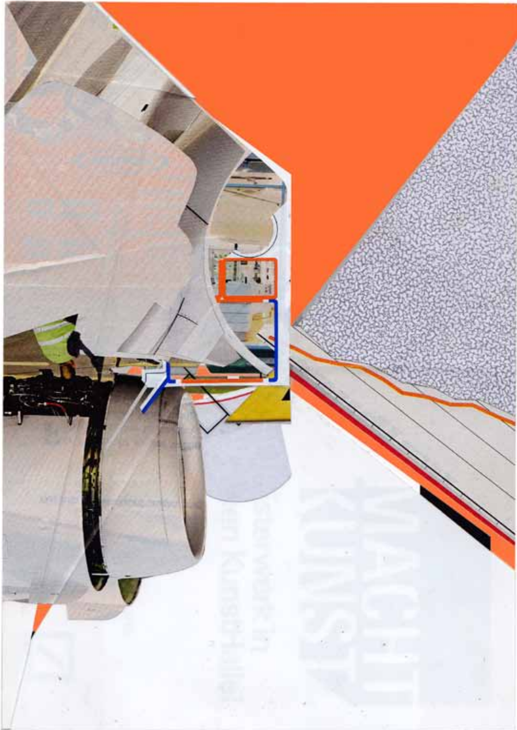
Marc von der Hocht Craft 2014, 8,27 x 5,83 in. (21 x 14,8 cm) Mixed Media