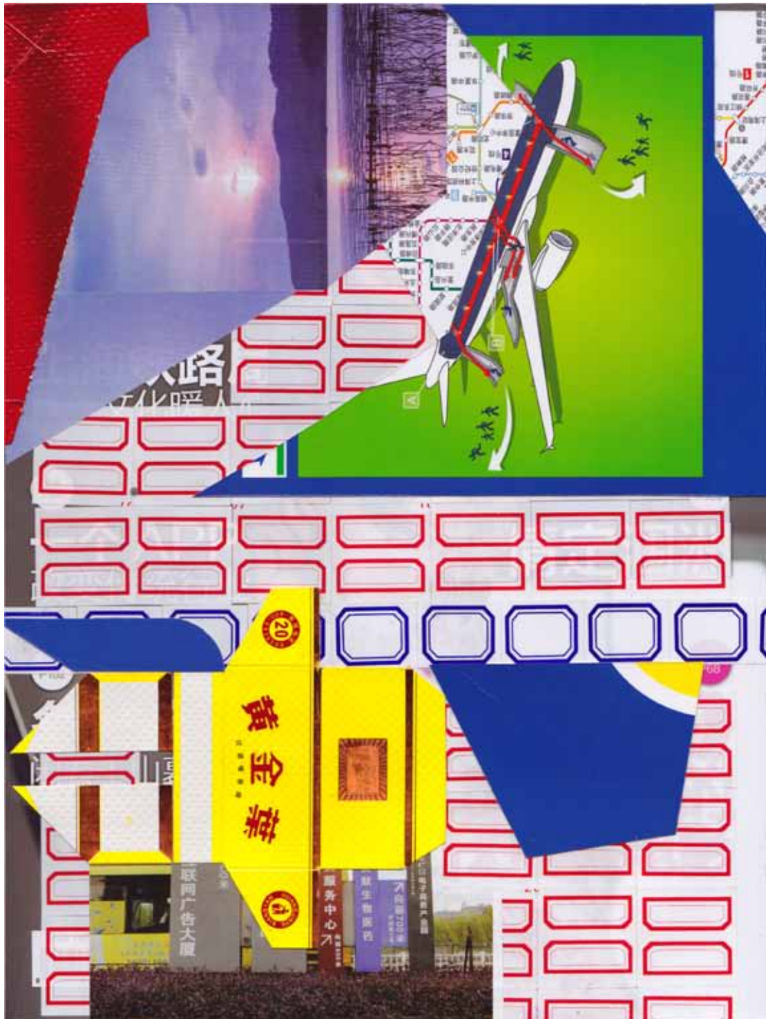
Marc von der Hocht Xujiahui 2015 10,91 x 8,15 in. (27,7 x 20,7 cm) Mixed Media