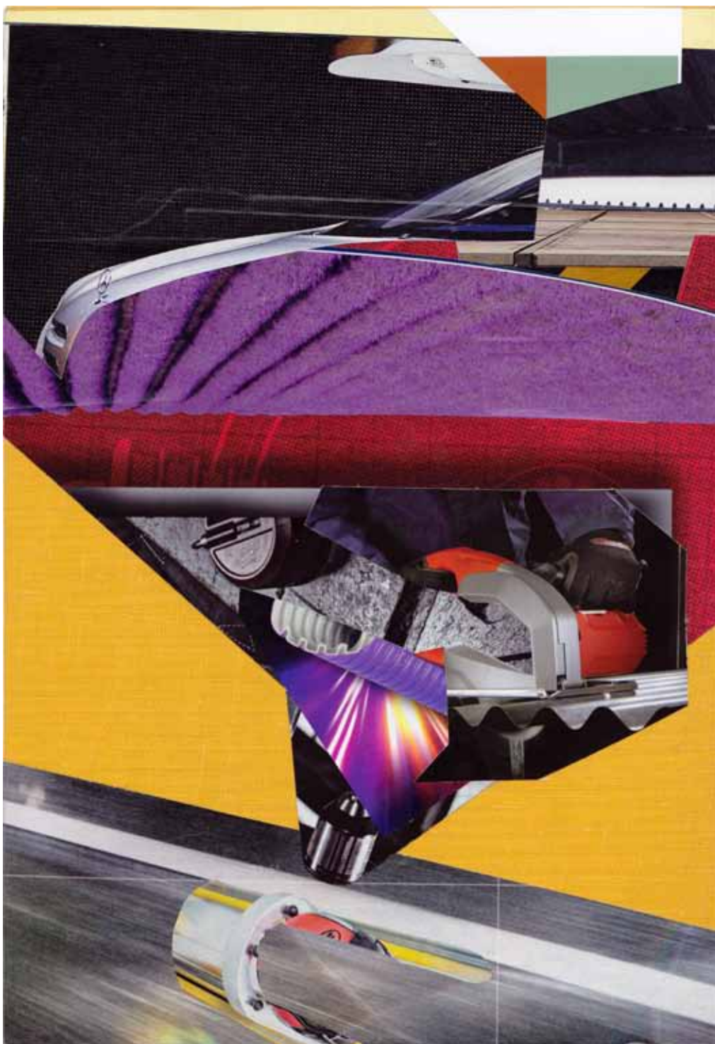
Marc von der Hocht Apex 2014, 9,23 x 6,54 (24,2 x 16,6 cm) Mixed Media