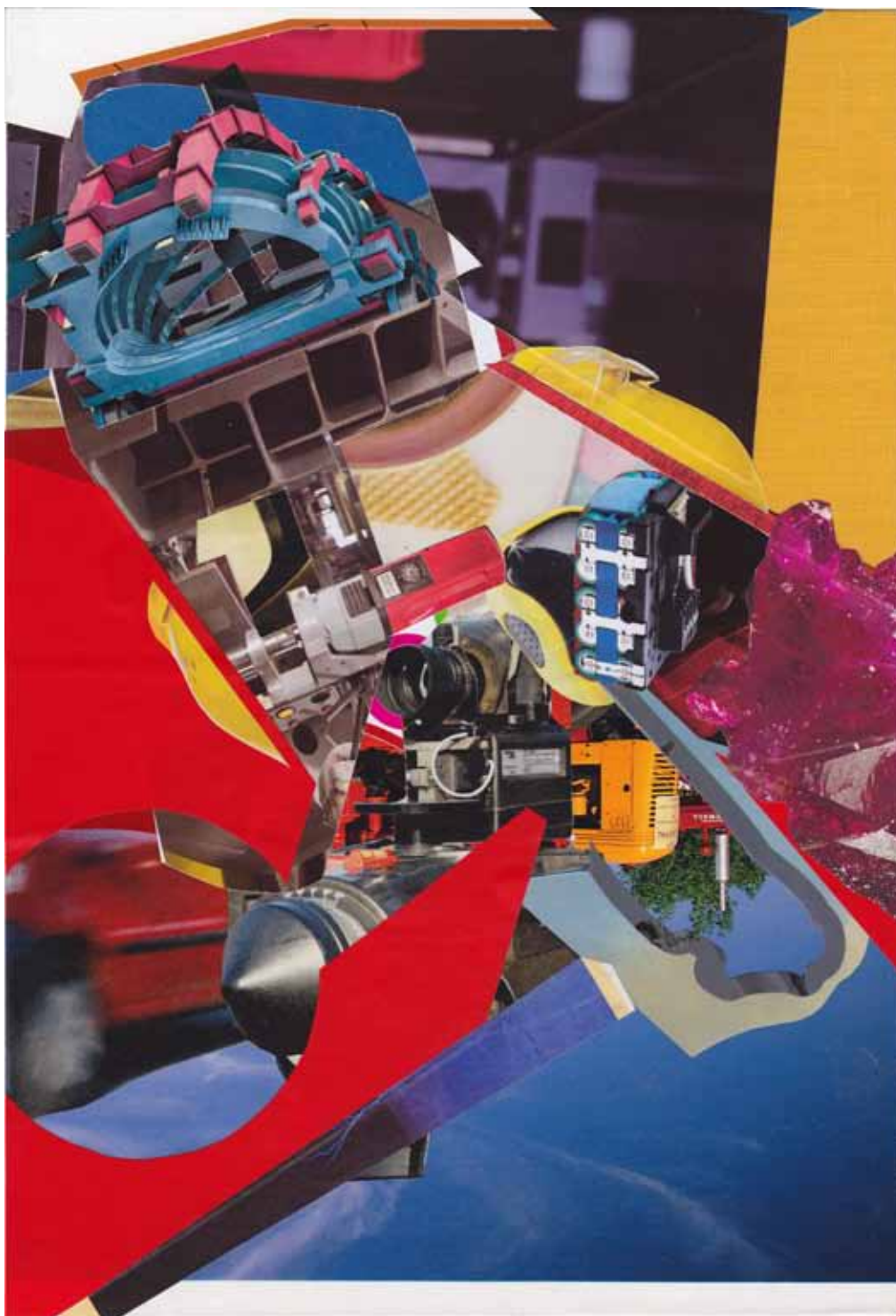
Marc von der Hocht Turmoil 2014, 9,47 x 7,32 in. (24,3 x 18,6 cm) Mixed Media

SEMJON CONTEMPORARY GALERIE FÜR ZEITGENÖSSISCHE KUNST