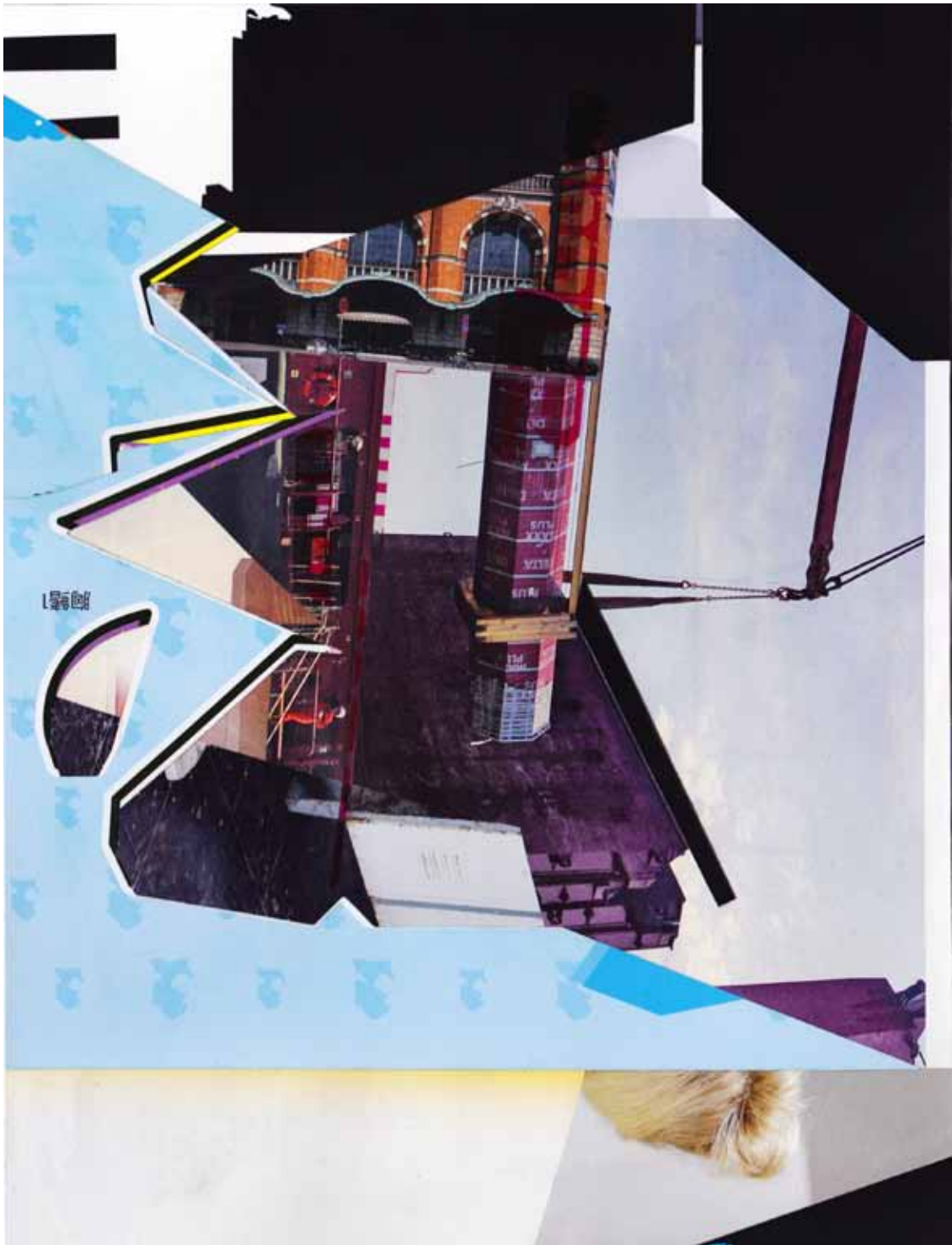
Marc von der Hocht Valvar 2015, (29,4 x 22,9 cm) Mixed Media