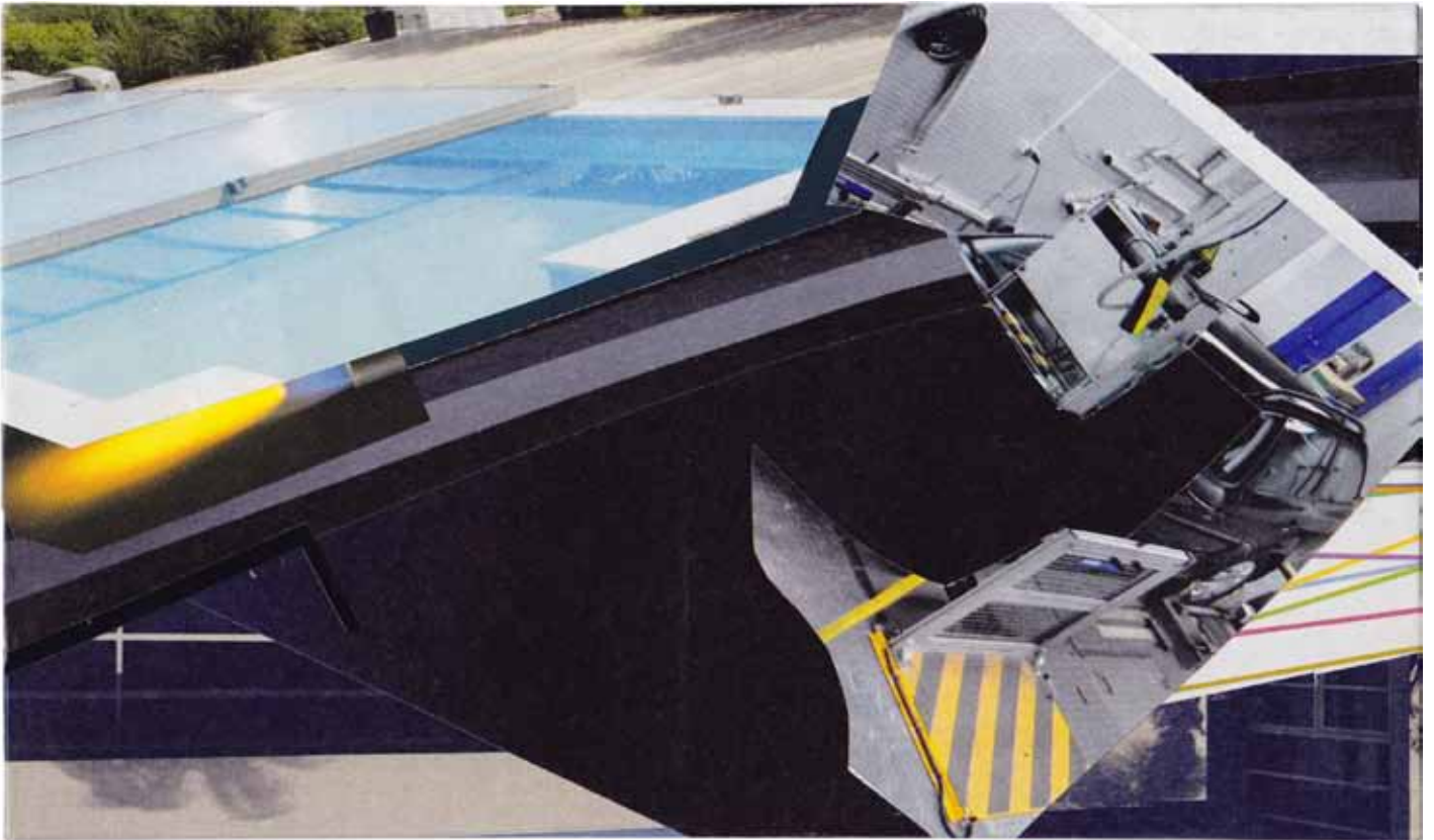
Marc von der Hocht Flavic 2016, 4,61 x 7,17 in. (11,7 x 18,2 cm) Mixed Media