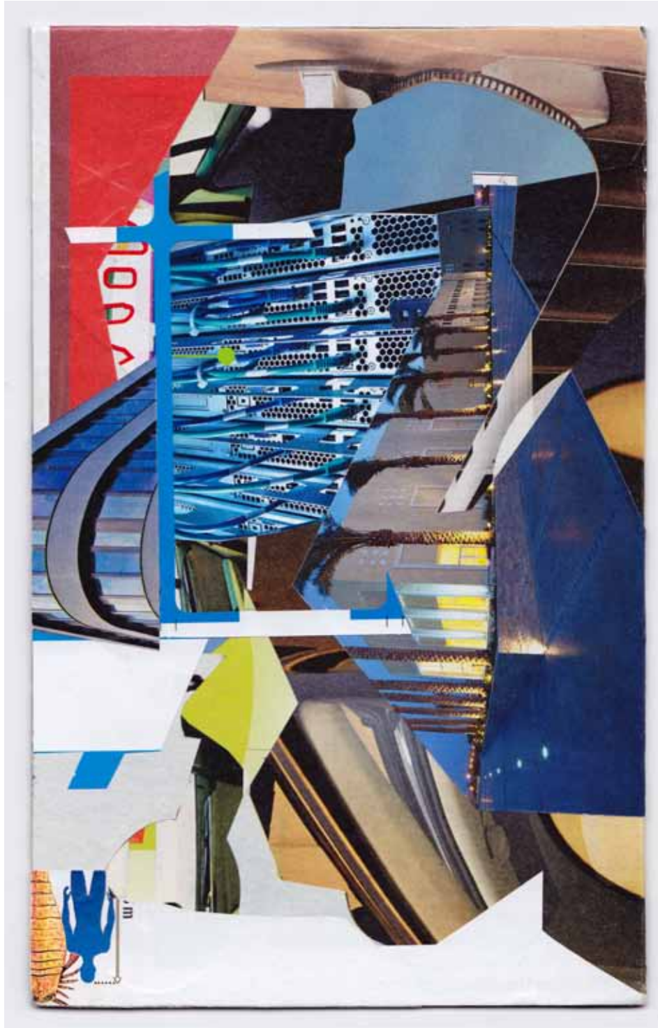
Marc von der Hocht Simbi 2016, 7,32 x 4,57 in. (18,6 x 11,6 cm) Mixed Media