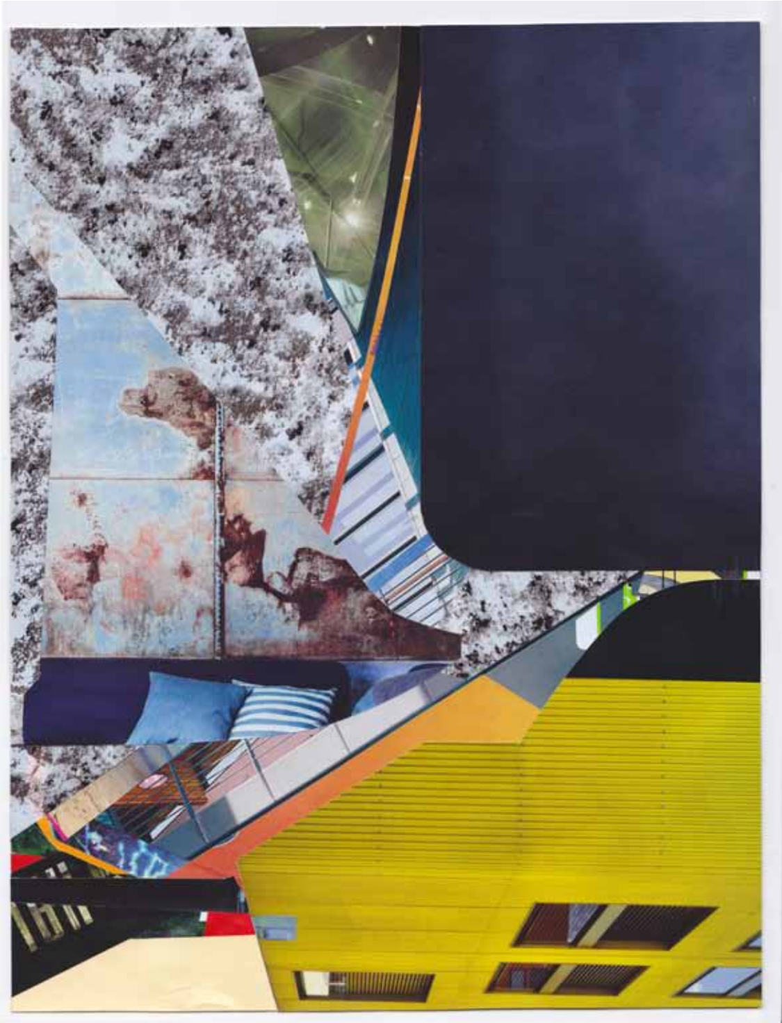
Marc von der Hocht Trica 2015, 10,31 x 7,87 in. (26,2 x 20 cm) Mixed Media

SEMJON CONTEMPORARY GALERIE FÜR ZEITGENÖSSISCHE KUNST