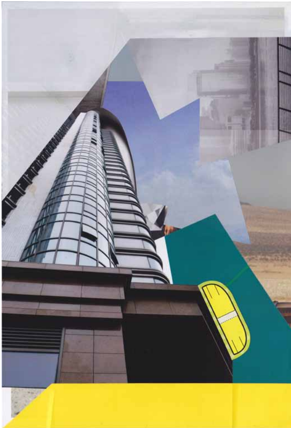
Marc von der Hocht Baoshan 2015, 14,82 x 14,06 in. (37,7 x 35,7 cm) Mixed Media