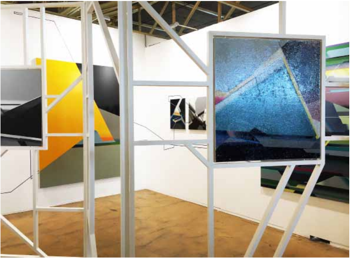
Marc von der Hocht Art Rotterdam 2016 View at the gallery stand with a solo booth by Marc von der Hocht