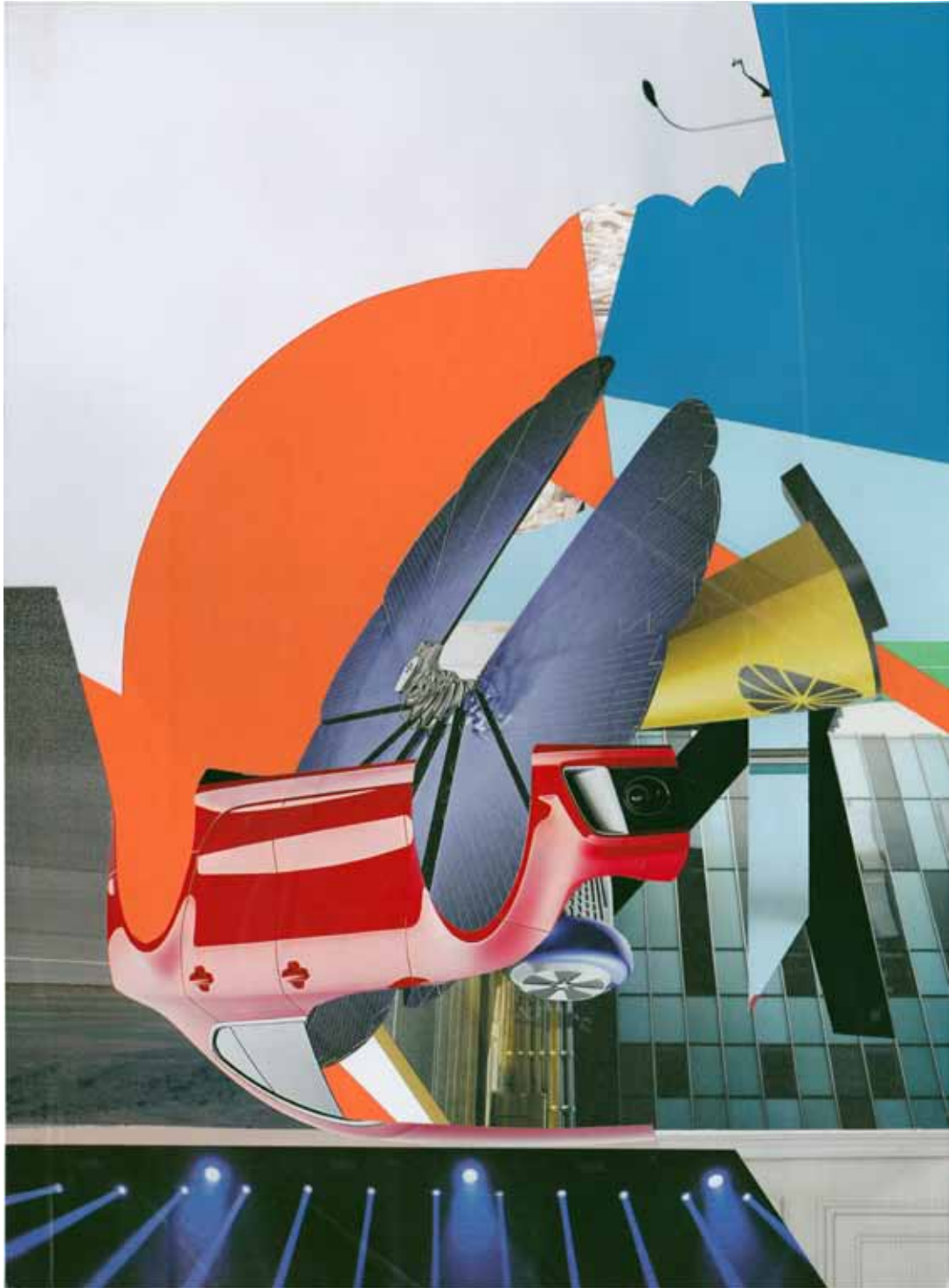
Marc von der Hocht Yangsi 2015, 14,76 x 10,83 in. (37,5 x 27,5 cm) Mixed Media

SEMJON CONTEMPORARY GALERIE FÜR ZEITGENÖSSISCHE KUNST